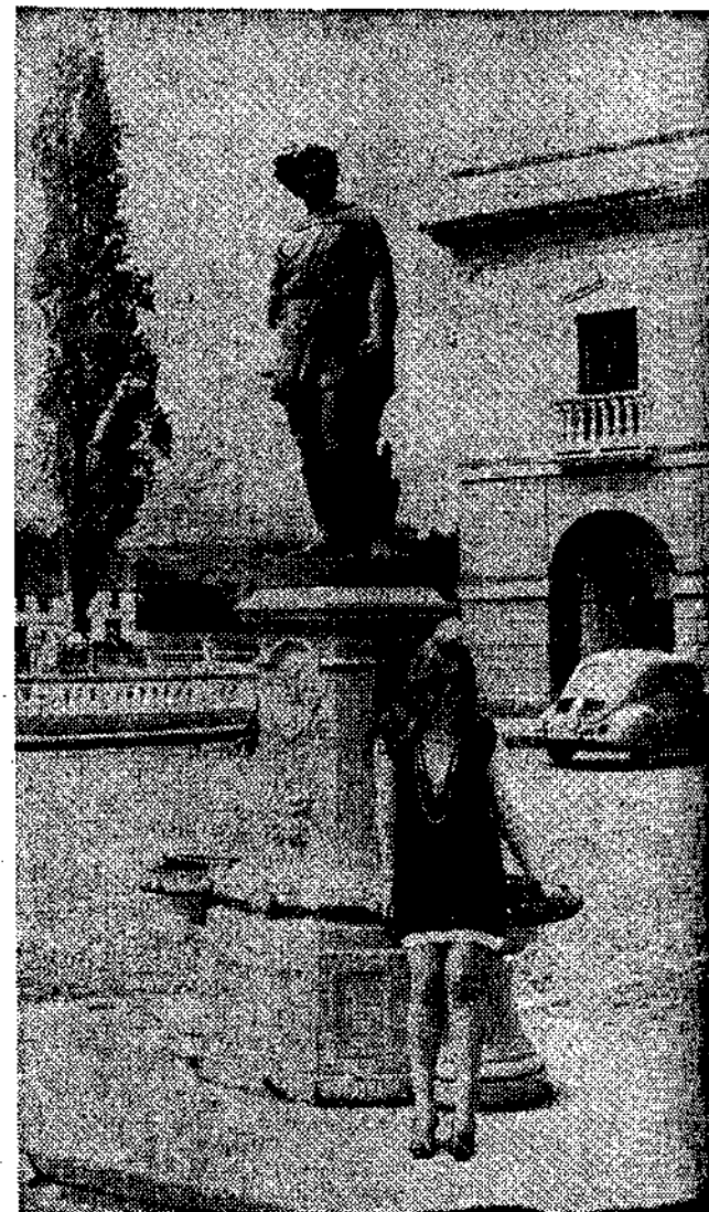
Una postura para el fotógrafo: hay que pregonar la belleza de la villa

Y colabora también la Organización Sindical. Naturalmente las dificultades serán mayores así como crezca la importancia de la Feria que necesita ya abrirse nuevos horizontes, disponer de otros espacios. Pero de esto hablaremos otro día, que habrá oportunidades para ocuparse de esta Feria que abrirá sus puertas el 13 de este mes.