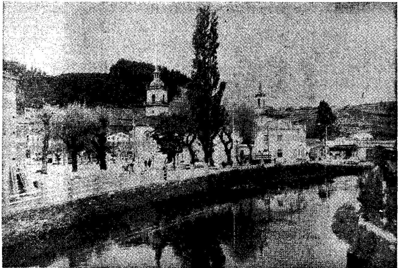
Nueva imagen del Vegadeo repuesto de las inundaciones. De desaparecidas las ruinas, todo está ya preparado para recibir a la Feria