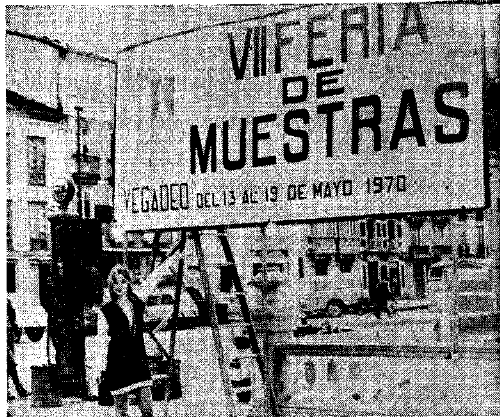
Violeta nos señala la fecha de la Feria e invita a todos los asturianos a acudir a Vegadeo

sos de cincuenta pesetas hasta alcanzar cuarenta y seis mil pesetas. Se cuenta con el apoyo decidido de la Cámara de Comercio de Oviedo y una subvención de veinticinco mil pesetas. Otras tantas las envía la Diputación, una cifra inicialmente simbólica que habrá de ser revisada en orden a la importancia de la Feria.