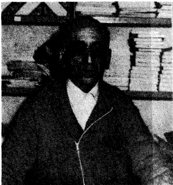
Mejeras, más de medio siglo defendiendo el puente.