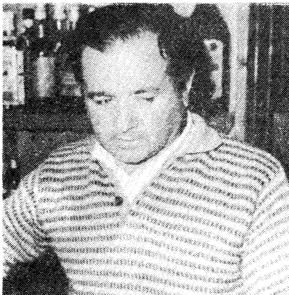
«En Vegadeo pensamos que el puente no nos va a dar nada bueno».