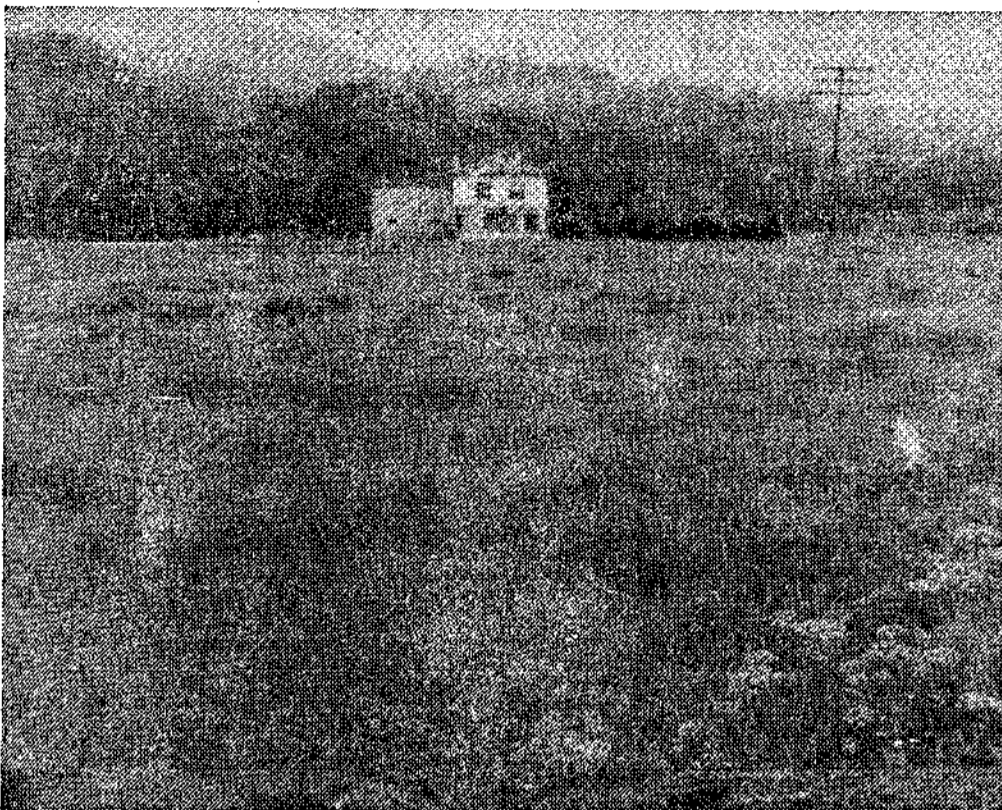
Finca de «Otalde», próximo escenario del Concurso provincial de arada.

(De nuestro corresponsal, José Emilio LONGO). — Por fin, tras airear reiteradamente en estas páginas la carencia en la localidad de un ambulatorio de la Seguridad Social, donde atender dignamente a los pacientes asegurados, pacientes tanto en el aspecto clínico como por el largo compás de espera en torno a la cuestión, hoy recibimos información de la Organización Sindical que preocupándose del grave problema ha dirigido escrito al Consejo Provincial de Trabajadores, quien a su vez interesó contestación al respecto del Instituto Nacional de Previsión, siendo esta última la siguiente: