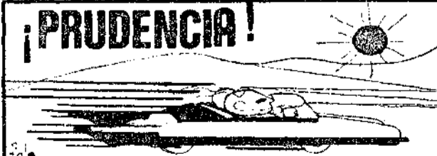
LA CARRETERA NO ES UNA PISTA DE COMPETICION

Mucha gente pesca truchas en el lago artificial de Castiellas, propiedad de la piscifactoría, quien da medios y facilidades, cobrando un pequeño canon por capturas.