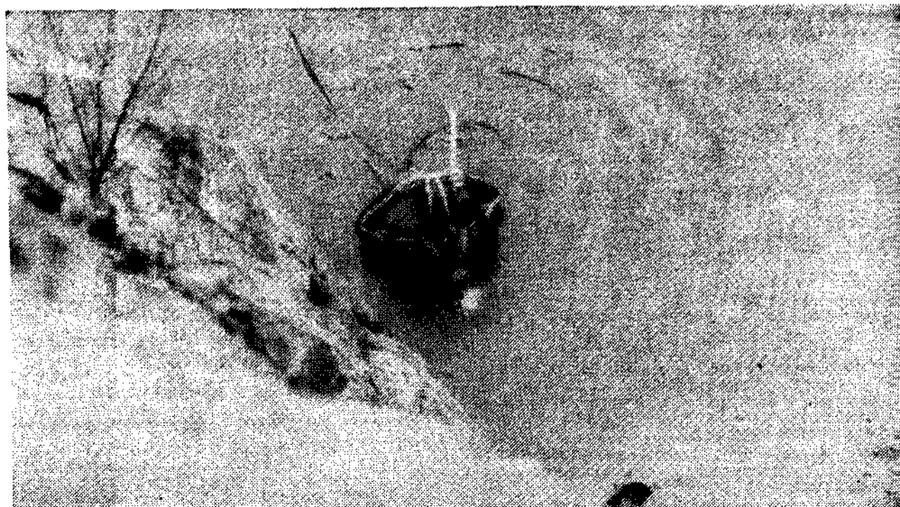
Momento de la inmersión, para una exploración que resultaría infructuosa