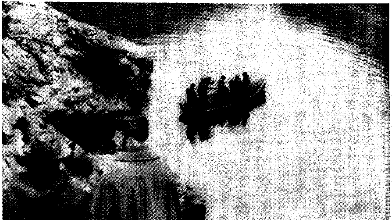
La barca, centro de operaciones flotante