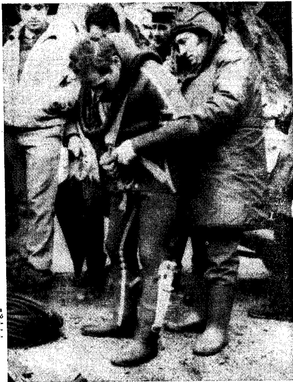
Mucha expectación en la orilla. Se resistió bajo la lluvia, esperando aclarar el misterio de los tres desaparecidos