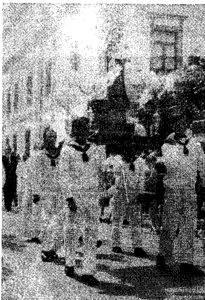
Los soldados de Marina no ceden a nadie el privilegio de llevar en hombros a la Virgen

baneras" de sus años mozos. Y mientras la chiquillería come con el último caramelo y los jóvenes bailan y se divierten, los ya maduros recuerdan, al filo del atardecer, aquellas fiestas de antaño, con las veladas teatrales en el Ayuntamiento, aplaudiendo un sainete de temas costumbristas del, además de buen médico, no menos buen literato que fue don Eugenio Lebrede. Y, entretanto, en La Guardia o en La Atalaya, atentos y vigilantes siempre de la inmensa mar, unos viejos pescadores que a ella entregaron sus horas, sus días, su vida, en su vida, evocan --quizás-- los versos del poeta. "De la miseria humana naufrago soy en este mar [abierto] y al son de la campana que por mi doble a muerto llevame, Madre, al suspirado [puerto].