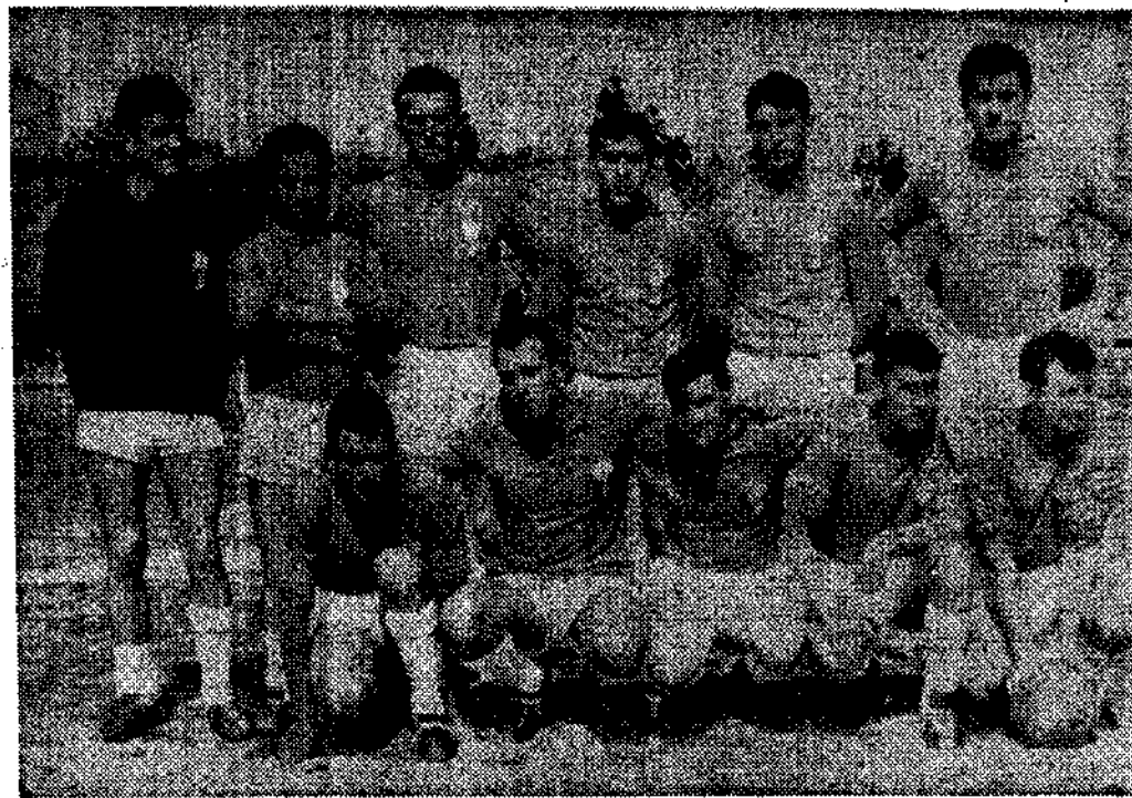
Una de las últimas formaciones del Real Tapia C. F.