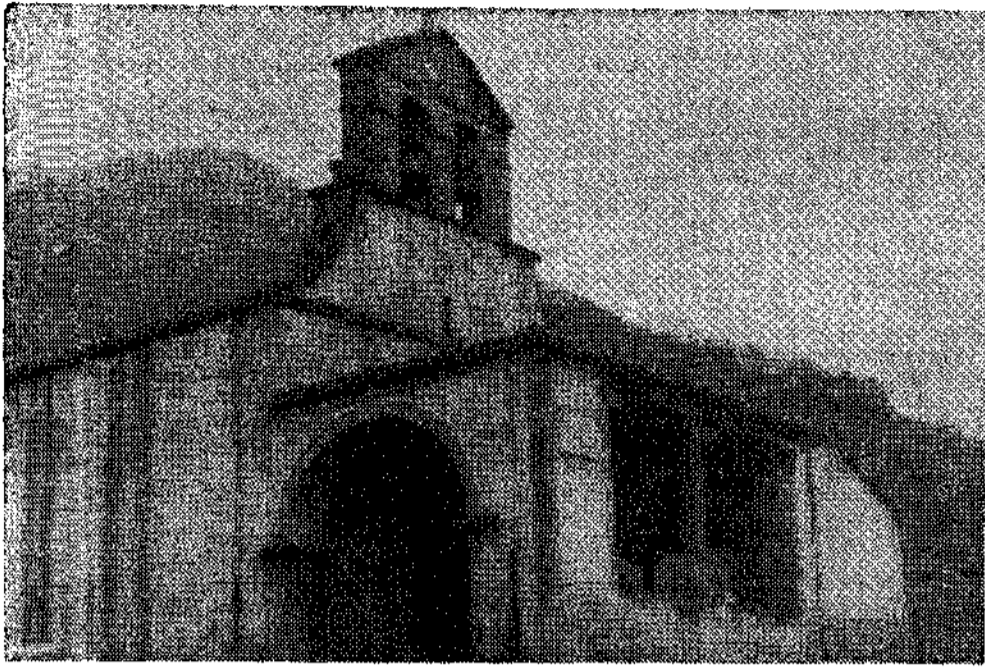
San Juan de Llamas

(De nuestro corresponsal, Luis CALLEJA OCHOA).