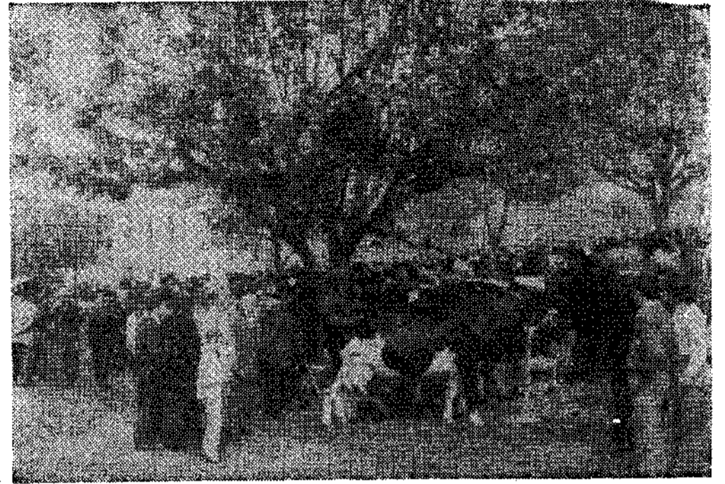
Una de las últimas ferias en La Roda