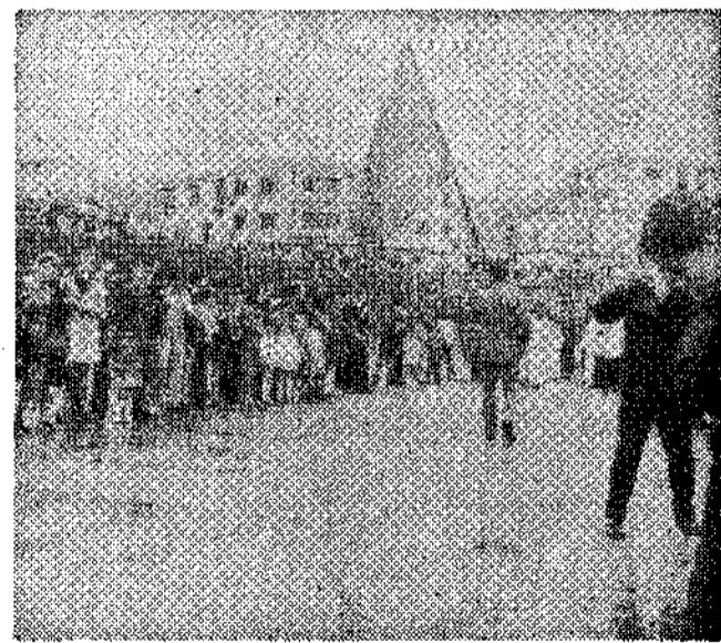
Hay que promocionar «La Venia»

Según mis cálculos Luanco se pondrá en la próxima semana a un setenta por ciento de su caudal veraniego. El contagio del «miniverano» pas cual sobrepasa ya las fronteras provinciales; de Madrid, León, Salamanca —¡quién lo diría!—, y otras muchas provincias españolas anuncian llegada en fechas próximas. No cabe la menor duda de que «algo ha mudado en la muy clásica, original, genuina y españolisima Semana Santa...» Uno no tiene la más mínima