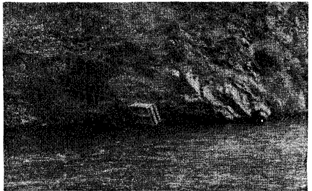
El cajón, después de roto el cable