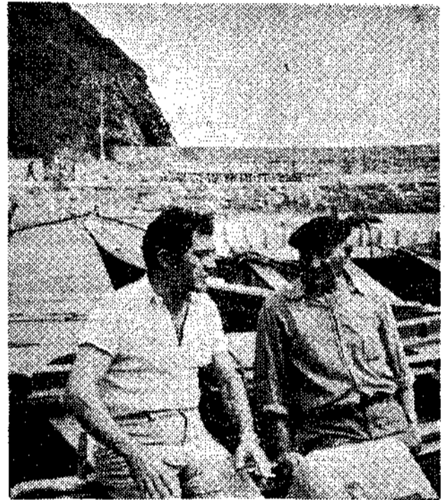
En el ruedo