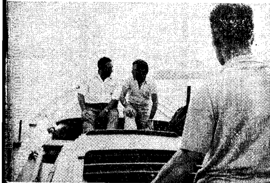
A bordo de la lancha, «Alfonso Navalón»