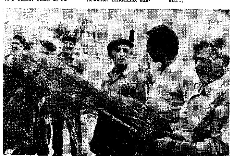
Los de las redes y el del capote