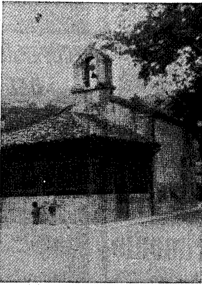
La añosa capilla, desde donde parte la carretera que une a los dos barrios.

La causa de las rencillas, de este malestar que preocupa a los hombres sensatos del lugar, radica en el haber conseguido la ambición por la que venían laborando desde hace muchos años: subir la carretera desde la plaza de la capilla hasta la de la iglesia, en el alto Pelúgano, quedando como un mal recuerdo el empinado y difícil «arroxu», causa de más de una fractura. Los vecinos dieron ejemplo de colaboración ciudadana y recaudaron más de cuatrocientos mil pesetas, que unidas a la ayuda municipal, hicieron que los 500 metros de mal camino se convirtieran en una pista por la que pueden circular toda clase de vehículos, aunque todavía hace falta el riego asfáltico.