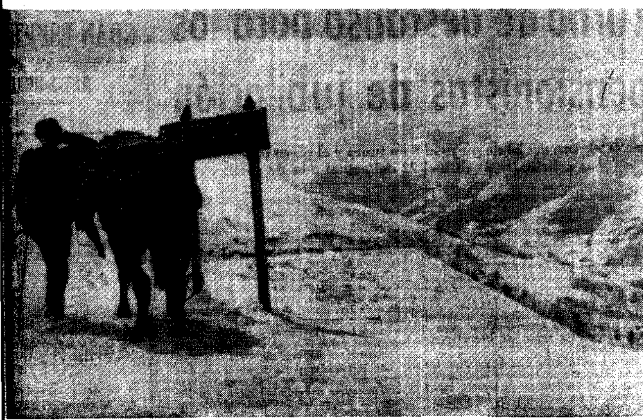
Montes de Quirós, hacia ellos vuelve la vista el concejo

—Fue un rudo golpe el cierre de las minas. Alegan que ya no son rentables. Que la explotación de estas minas de alta montaña resulta cara. No creen en eso. Siempre se nos dijo que el carbón de aquí era de calidad excelente. ¡Lástima! Se hacía dinero, la ganadería y el campo nunca se abandonó. Se alternaban las cosas. Había setecientos vacas. Y los setecientos terneros. Los más se fueron a la hora de tener que decidir, por el campo o la mina. En Bárzana no hay baile, ni