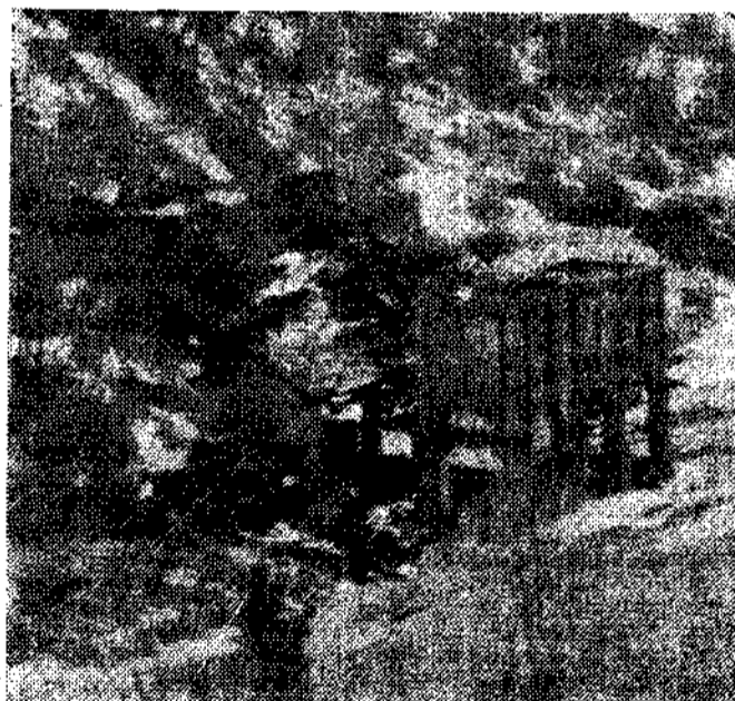
Restos de explotaciones mineras

cine, ni una catedral, ni un solo centro de diversión. Y en el Hogar una guapa moza, con sorna, comenta: —¿Sabe? Aquí nos divertí-