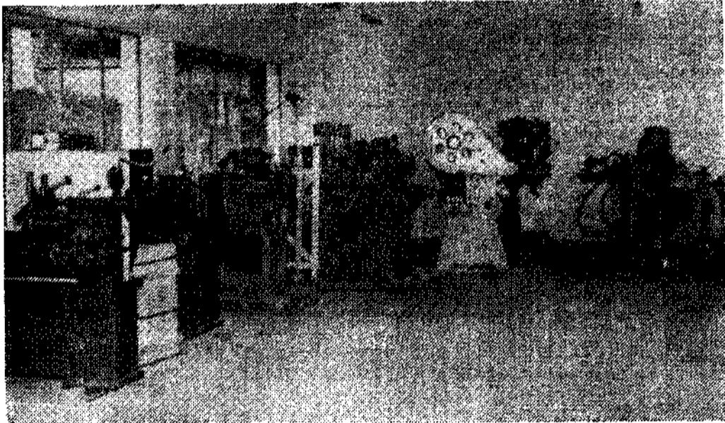
Parte de la maquinaria

Pero no solamente está concluido el edificio, sino que ya está en el mismo el material docente, como mesas de clases teóricas, de dibujo y de trabajo manual, todo ello cómodo, práctico y moderno. Ahora bien, lo que más llama la atención es la gran