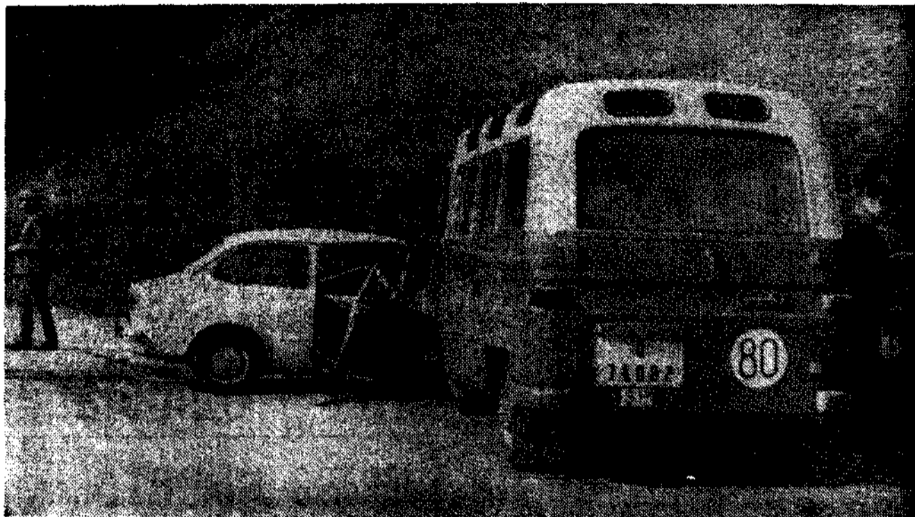
Valdesoto. (De nuestro corresponsal).

Una mujer resultó muerta y ocho personas heridas en un accidente de circulación que ocurrió alrededor de las cuatro y media de la tarde del domingo, en el kilómetro 8 de la carretera comarcal de Gijón a Sama.