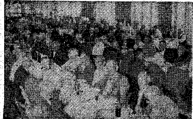
Aspecto que ofrecía el salón del Casino obrero durante la comida de hermandad que la Fábrica Nacional ofreció a sus jubilados.

Dentro del programa festero destaca por su tradición y emotividad el homenaje a la vejez.