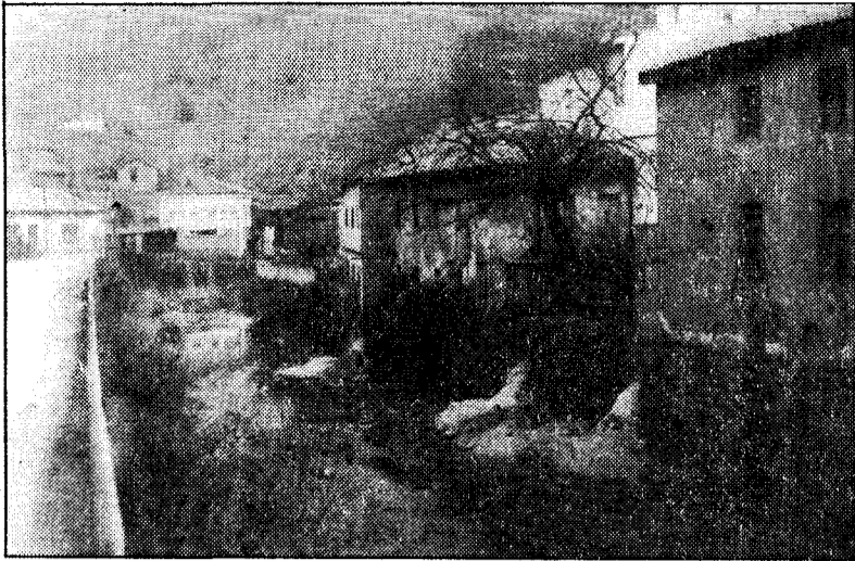
Pese a la supuesta temeridad de la adjudicación, las obras del colector de Turón siguen adelante