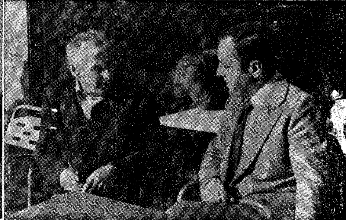
Nuestro colaborador hablando con el alcalde de Ribadeo

(De nuestro corresponsal, Pedro LLERA LOSADA).—La noticia de que por el Gobierno había sido resuelto favorablemente el proyecto de construcción de un puente sobre el río Eo, límite de las provincias de Asturias y Lugo, adjudicándolo a la entidad «Puente de los Santos, S. A.», que lo construirá, lo conservará y explotará durante un plazo de cuarenta años, ha llenado de satisfacción a muchos, pero también ha puesto un tanto tristes a unos pocos.