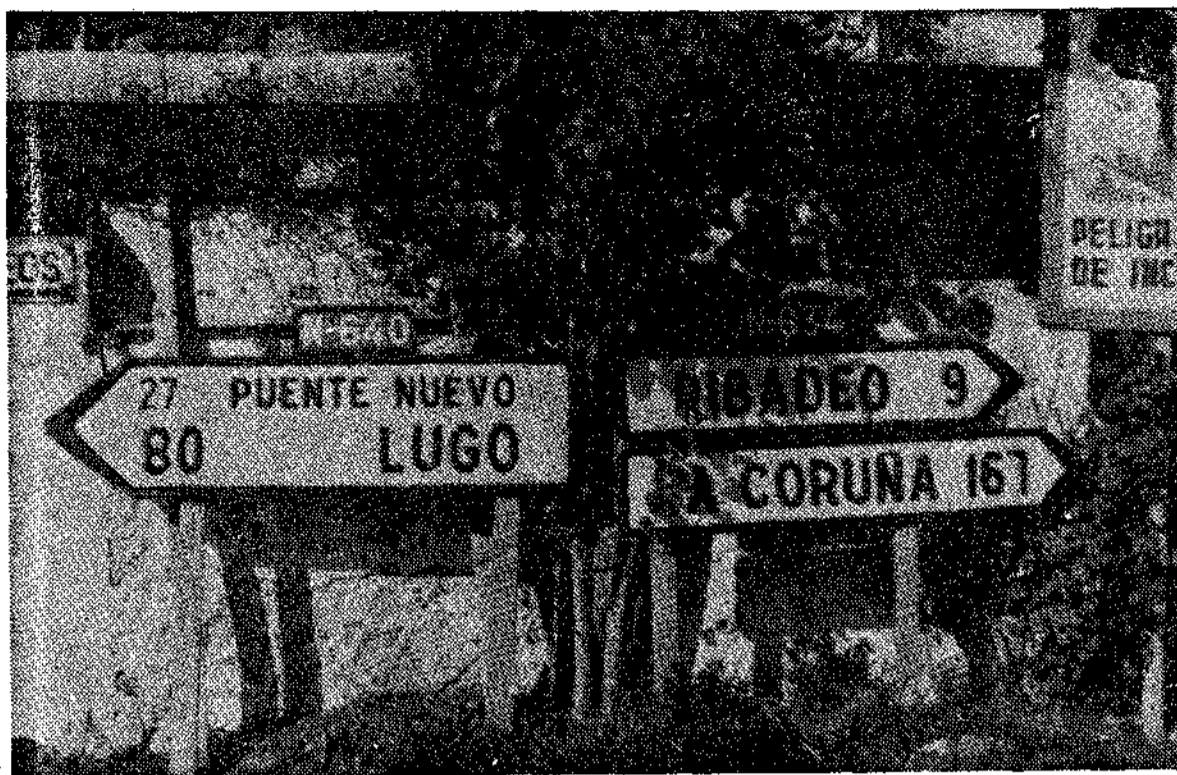
Por Vegadeo continuará la circulación hacia Lugo, Orense y Pontevedra