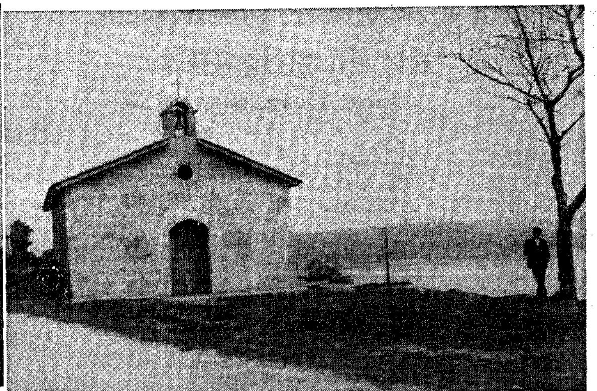
Ermita de San Miguel, en la provincia de Lugo