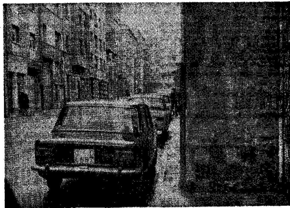
La fotografía nos muestra uno de los muchos accidentes que presenta la avenida de la Ar-