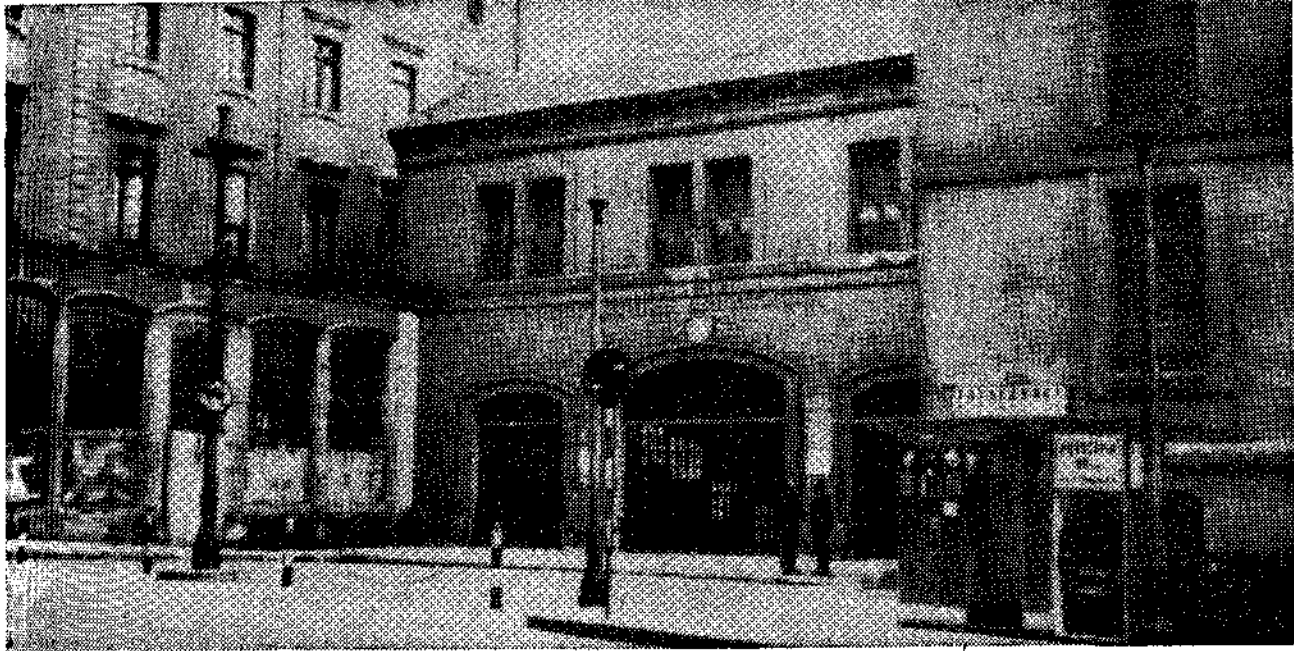
Exterior de la estación: ni pintura, ni reloj, ni alumbrado

Y «VIA LIBRE» PARA LA DEMOLICION DE LAS INSTALACIONES QUE DAN A LA CALLE GARCIA CONDE