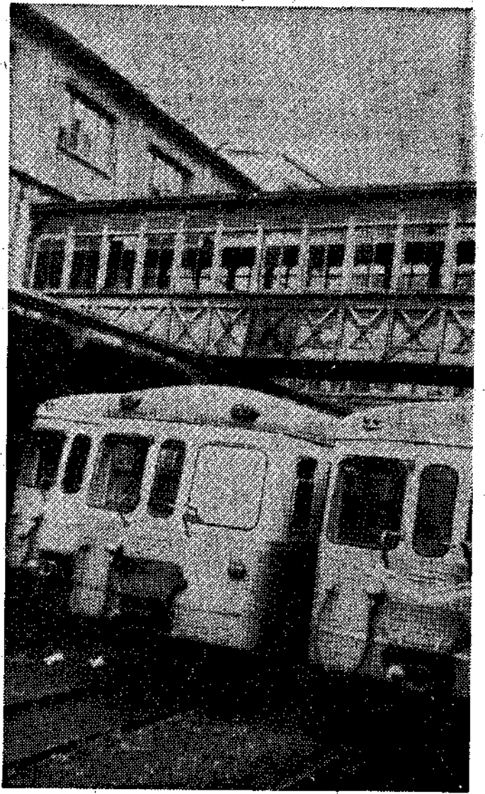
Los pasos superiores dejarán de prestar servicio. Lo mejor sería tirarlos, pero de momento van a ser "tapados" con grandes paneles.

ASUNTOS A TRATAR POR LA COMISION MUNICIPAL PERMANENTE