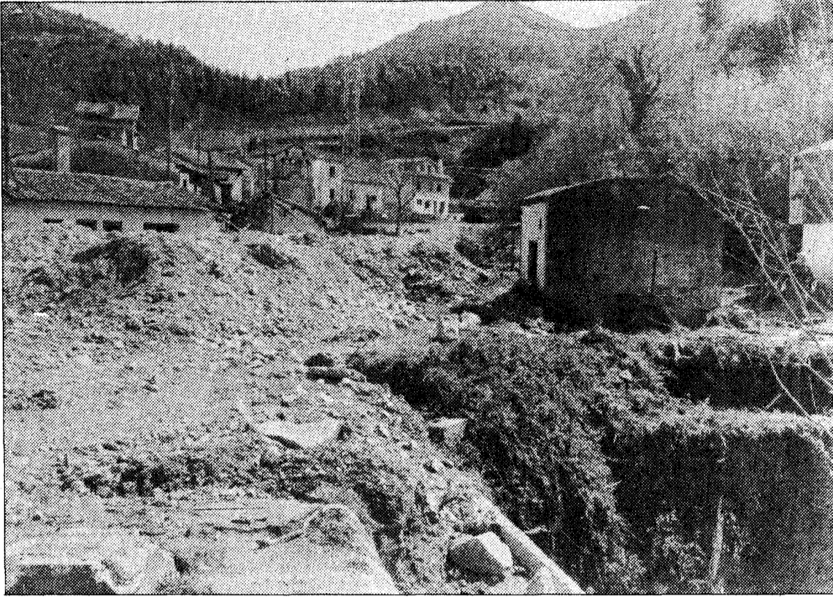
Terrenos en los que permanece el antiguo pozo de la explotación de Fluoruros, S. A.