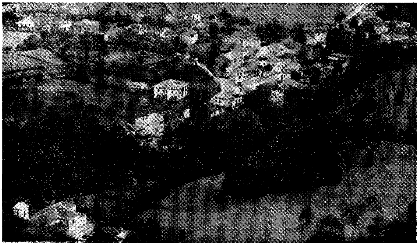
Panorámica de Benia, capital del concejo de Onís