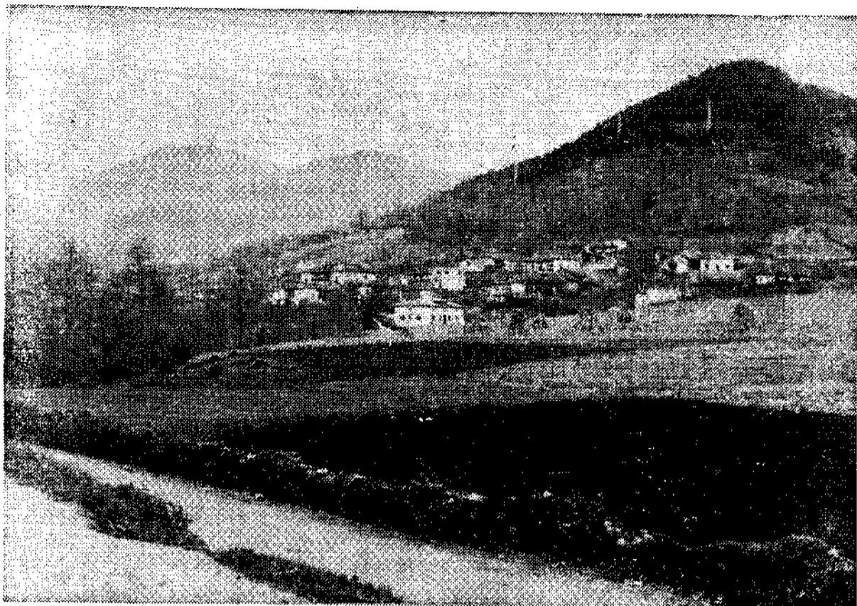
Sirviella; uno de los pueblos del concejo de Onís