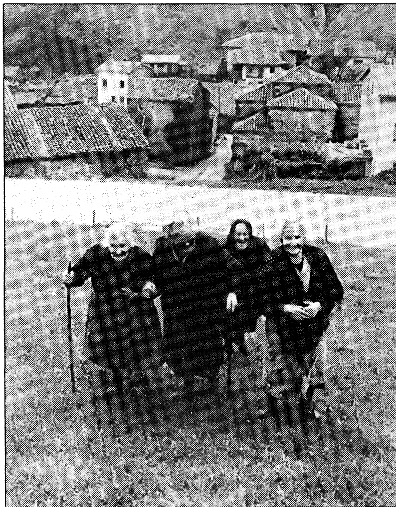
Las vecinas más ancianas, indignadas por la situación, suben al depósito para dejar clara su protesta.

El pueblo le ha planteado dos alternativas: Controlar su propia traida o aumentar la tasa de pago. Inútilmente. La respuesta ha sido negativa. «No hay duda, siempre estuvimos apaleados por el Ayuntamiento y seguimos igual. Aquí el cementerio, la carretera y la escuela