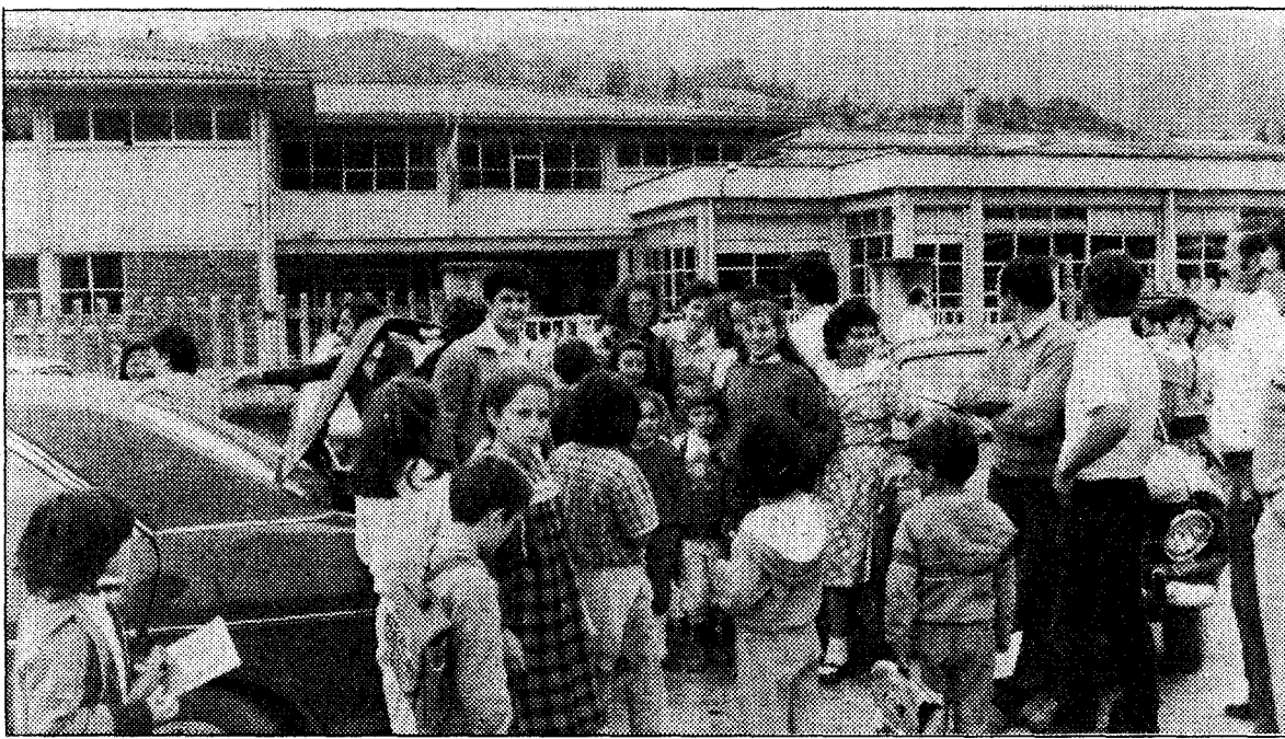
Los padres transportan todos los días a sus hijos al colegio de Arenas de Cabrales