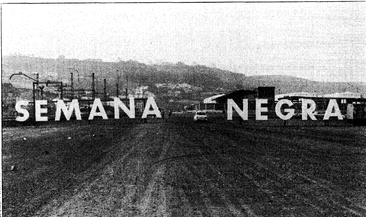
El acceso al lugar del crimen literario no pasa precisamente desapercibido.

En el último restaurante se puede contemplar una exposición de libros británicos, al tiempo que se echa un cuete o se despacha una fabada. Sobre todo, comida asturiana, servida por tres restaurantes de Gijón que se han asociado para gestionar el comedor, donde no falta una locomotora de vapor y un Fiat de los años veinte. En la pared se puede leer: «Esto no