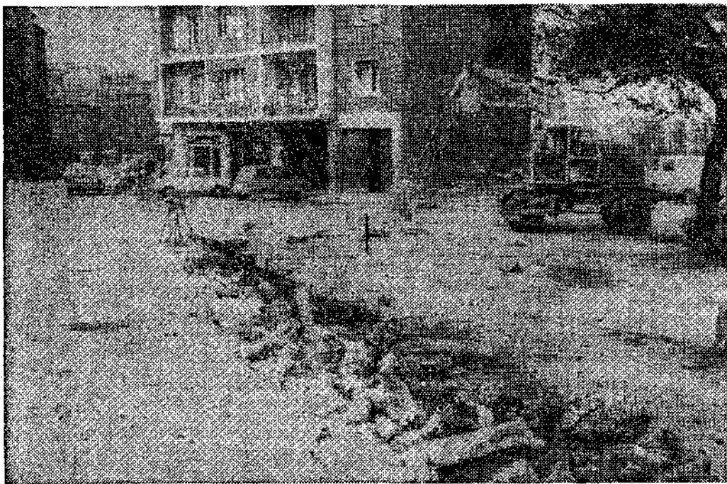
Comenzaron las obras de urbanización de la plaza de Santo Domingo

"La plaza de Santo Domingo es lugar de entrañables recuerdos para los ovetenses. Por el hecho de estar en las inmediaciones de la iglesia y convento de Santo Domingo, de haber tenido en su ámbito la tradicional Pontica de aguas medicinales magnésicas, y de