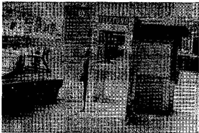
Unas cabinas, en el mismo paso de peatones, quitan visibilidad