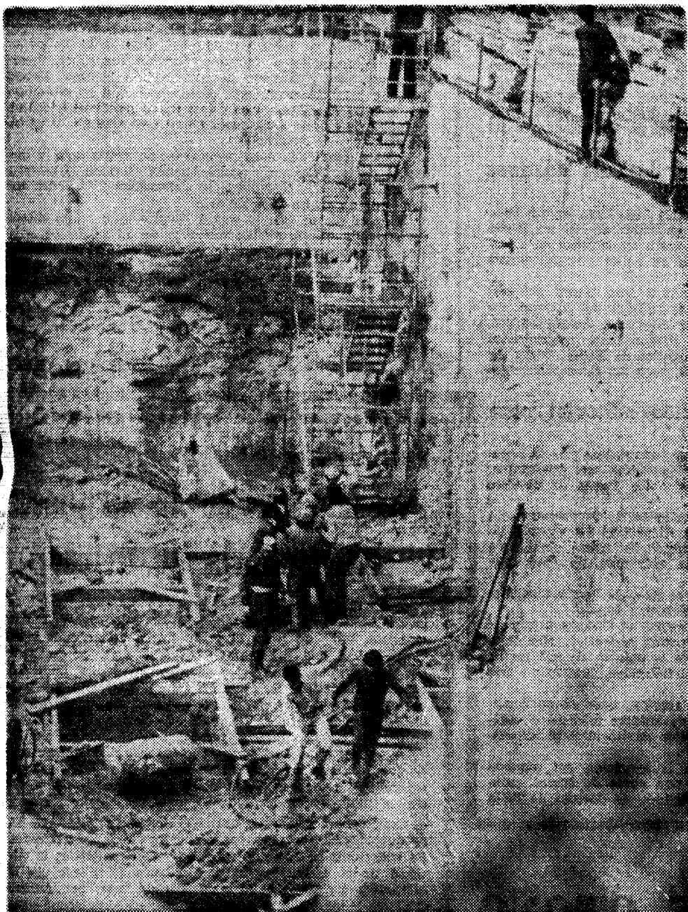
Uno de los heridos es recogido por compañeros y por soldados de la Cruz Roja