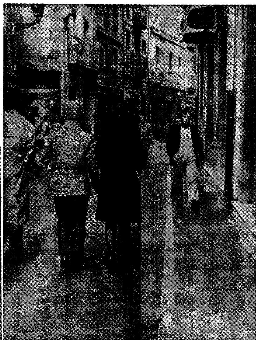
Pronto la calle Magdalena será una calle-salón

Tenemos que alabar la decisión municipal, que no tardará en ser dada a conocer oficialmente, de suprimir el tráfico rodado por la calle Magdalena. En los grabados pueden observarse claramente las dificultades y riesgos de los peatones para transitar por esta calle de insuficientes aceras. Como se hizo un día con la calle Jesús, sin crear ningún trastorno a la circulación de vehículos, se hará ahora con la calle Magdalena, en beneficio de la tranquilidad y seguridad de quienes van a pie. La misma prohibición para el tráfico va a extenderse, como ya conocen nuestros lectores, a las calles Pelayo y Palacio Valdés, que pasarán a uso y disfrute de los peatones, con esa categoría de «islas de la tranquilidad» que tanta aceptación han tenido en importantes ciudades.