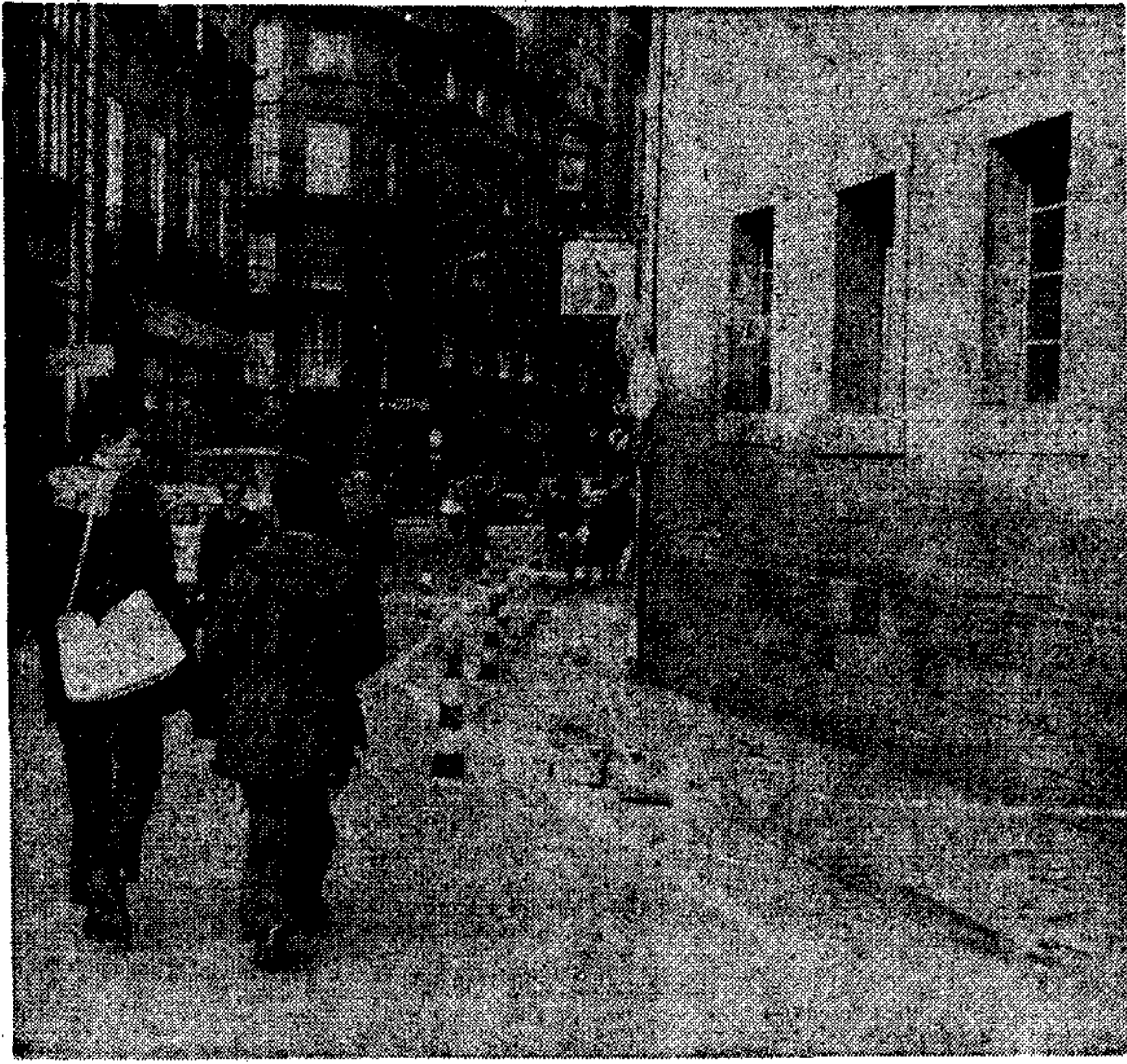
También en la acera izquierda de El Fontán serán suprimidos los coches, hasta las 3 de la tarde