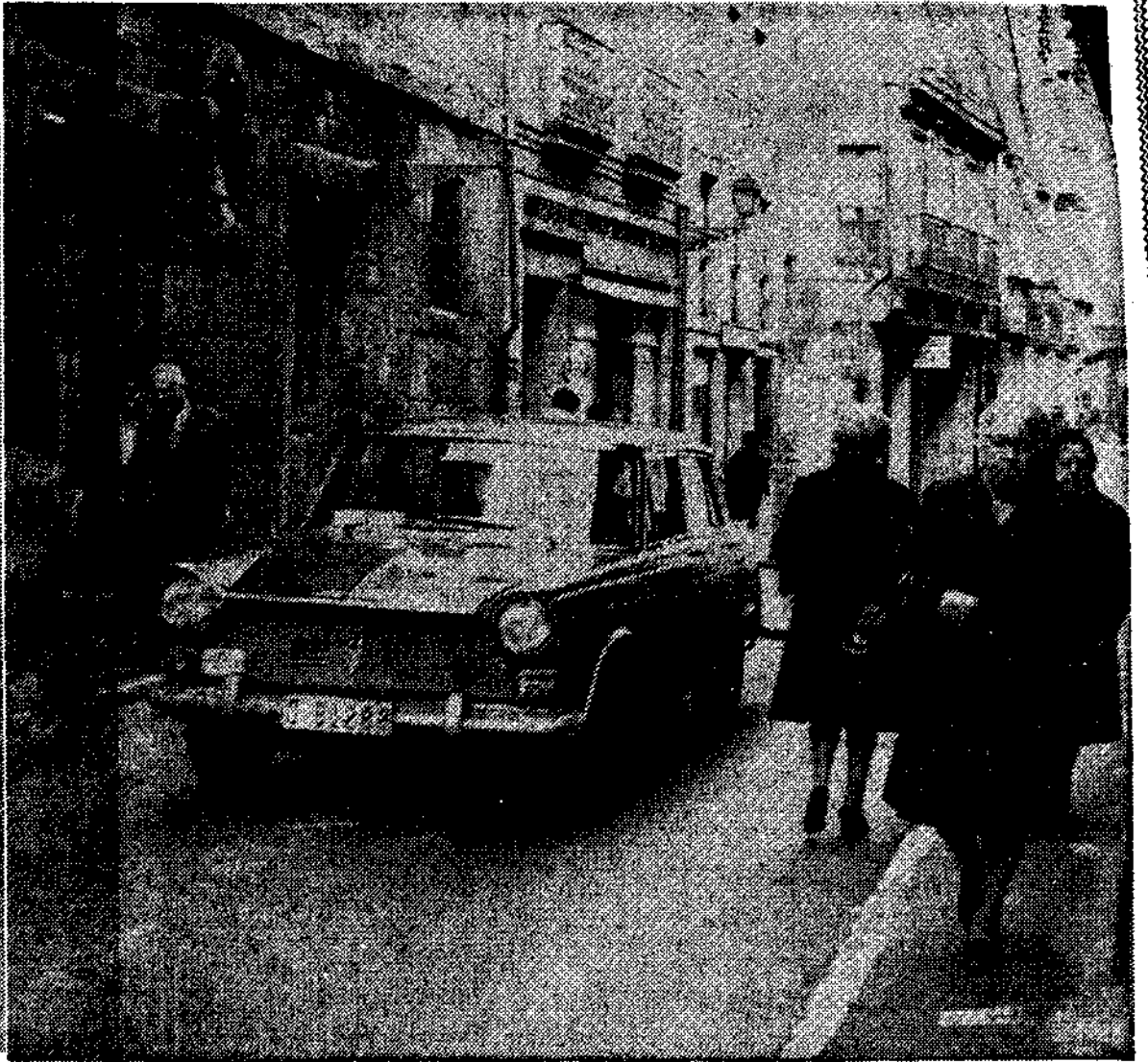
Los días están contados para el paso de coches por Magdalena