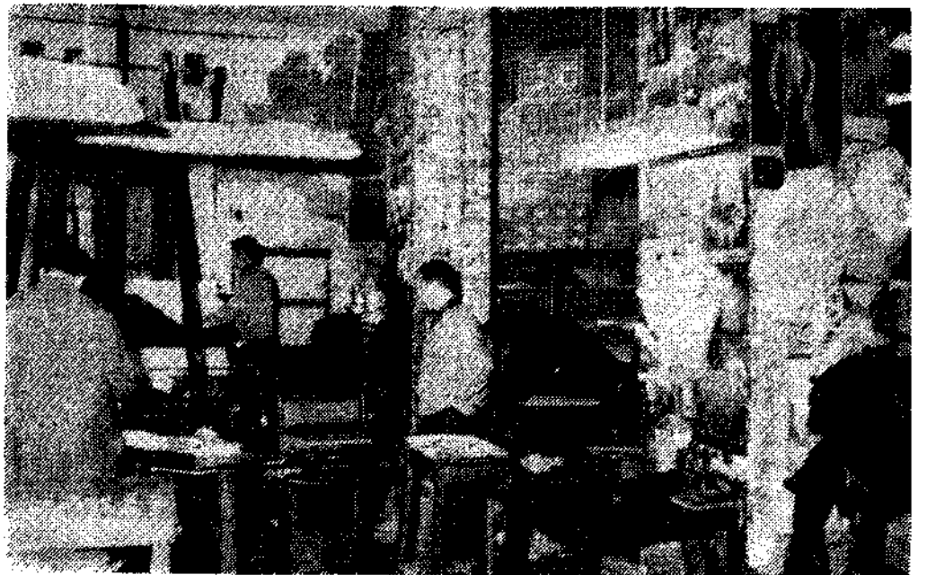
El taller de «El Oriente de Asturias»

—Hay tantas que ahora no me viene a la memo-