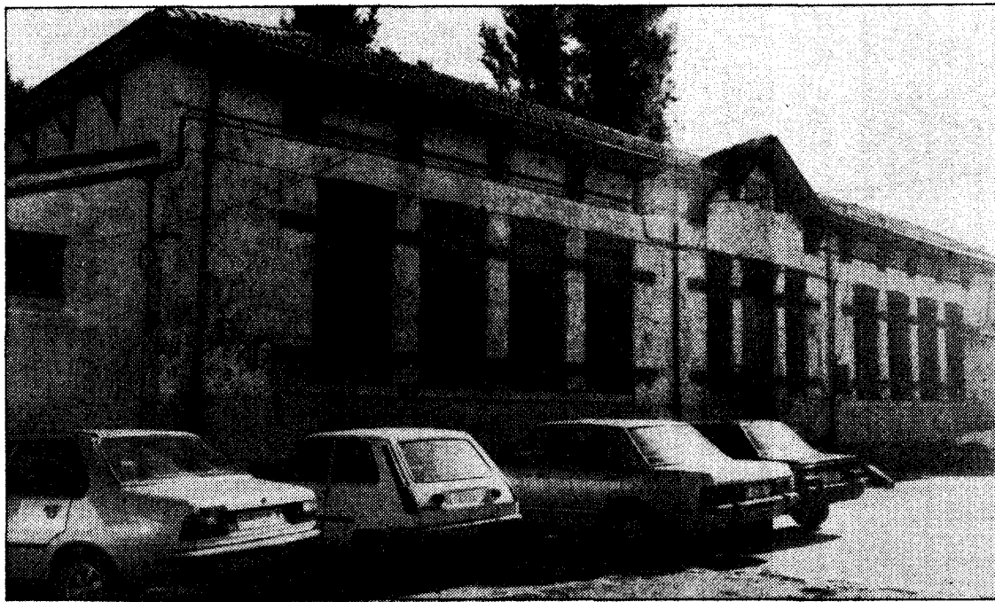
La guardería de San Nicolás, que el Ayuntamiento considera necesario derribar para construir la nueva casa de la cultura

Cargando: «Artemis 1», abono; «Dedaynyay», productos siderúrgicos; «Ocean Trader», productos siderúrgicos.