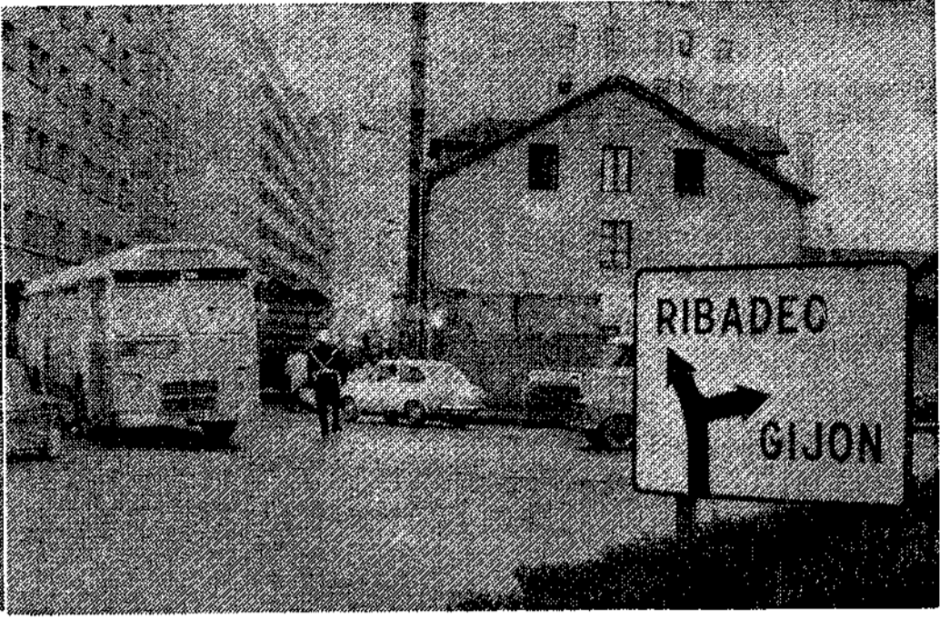
Plaza de los Oficios; un "punto negro" en la circulación rodada

Una pregunta que muchos avilesinos se hacen