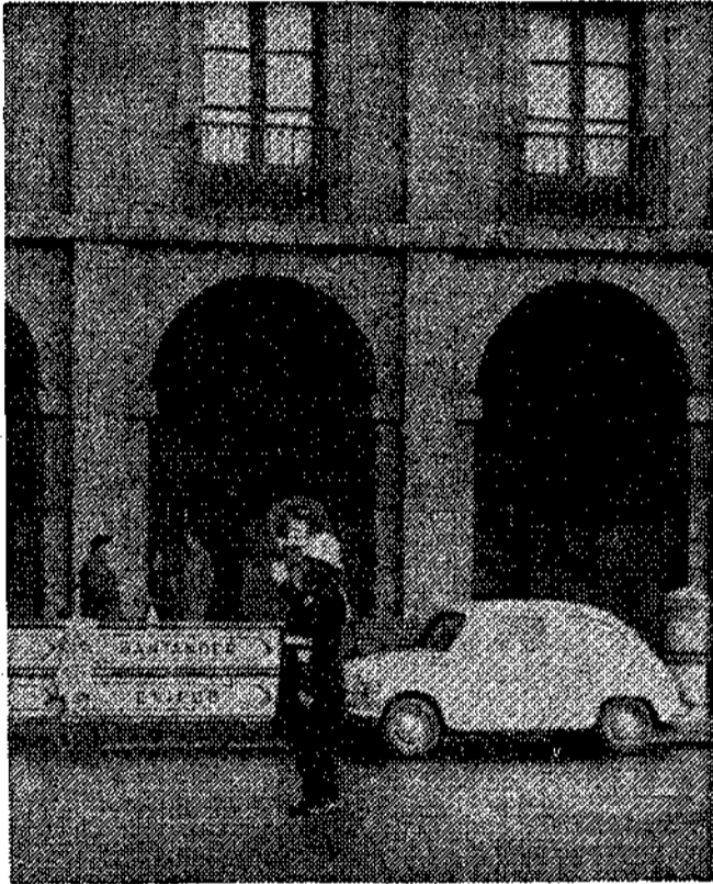
La plaza de España