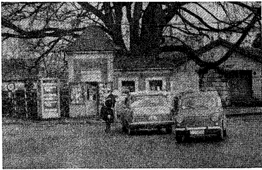
Entrada a Avilés por la carretera de Oviedo