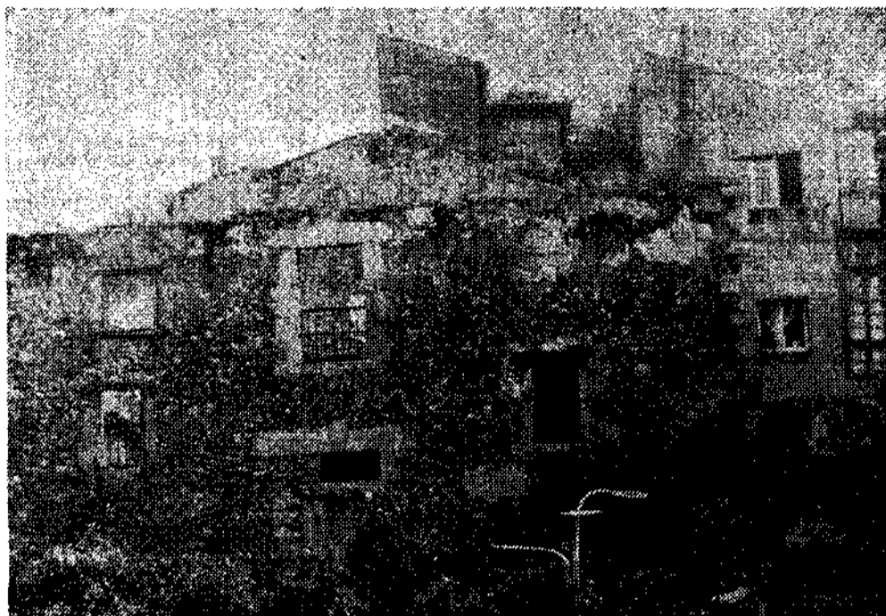
La llamada "casa de Pedro Menéndez" se cae poco a poco, mientras espera la tan ansiada restauración.