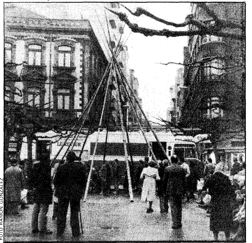
Un grupo de cincuenta personas integrado en lo que denominan «Universidad Itinerante del Retorno» llegó ayer a Gijón en una nueva escala de las muchas que vienen realizando desde el año 1973, cuando comenzaron un proyecto cuya razón reside en la «toma de conciencia frente a los grandes problemas contemporáneos, ecológicos, socioeconómicos y humanos». Una parte de este grupo se instaló ayer por la tarde en la plazuela de San Miguel, donde levantó una enorme tienda de campaña que ellos llaman «guam». Desde ella se dirigieron a los que quisieron oírlos, para explicarles su teoría acerca de la «facultad de silvilización», es decir, la capacidad de vivir con métodos derivados de las civilizaciones primitivas.