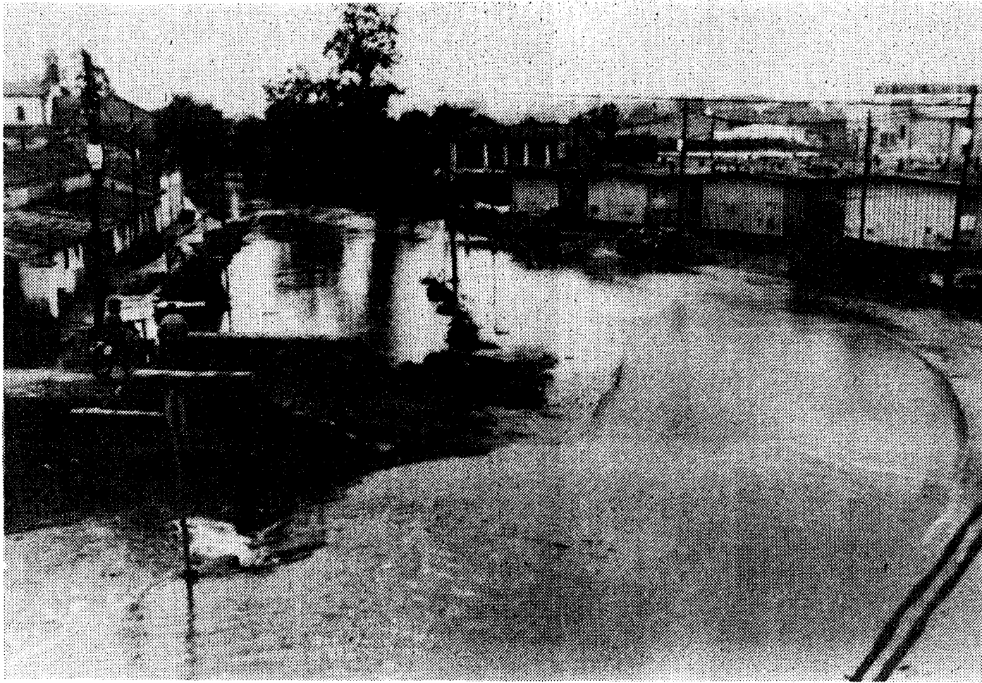
En este estado quedó la zona de Tremañes durante las inundaciones de anteayer.