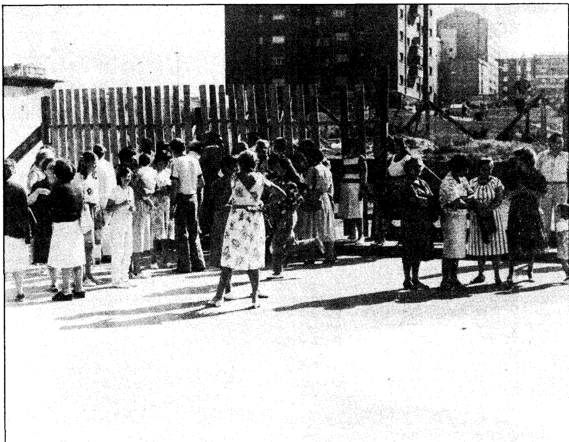
Un grupo de vecinos del polígono de Pumarín bloquea la entrada al solar donde está previsto construir las viviendas sociales