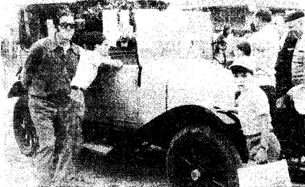
Un coche viejo, expuesto en la Feria.