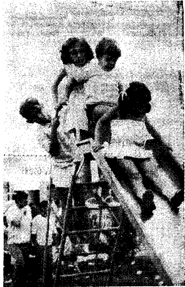
Los peques también disfrutan de la Feria.

Es un sitio, que sólo está prohibido a una clase de personas: las que están sometidas a régimen de adelgazamiento.