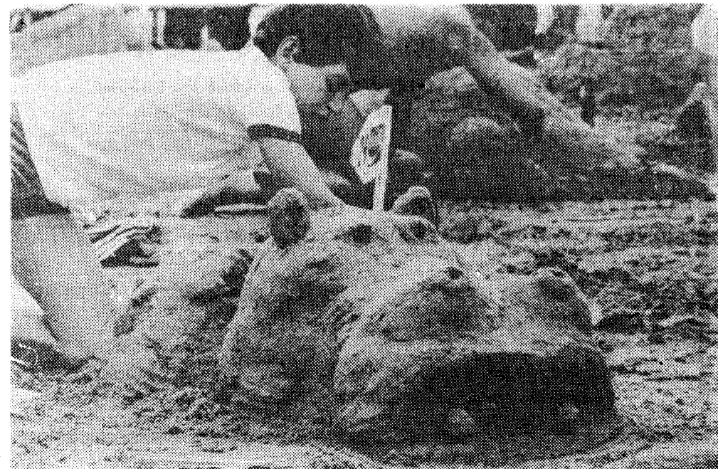
Otro de los concursantes.