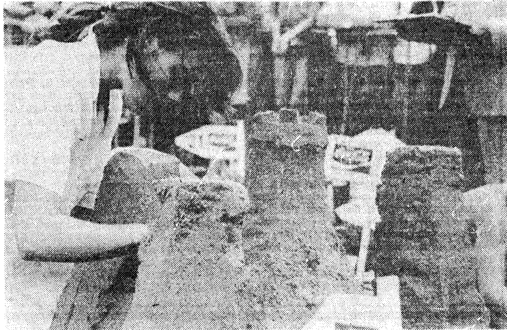
Una concursante con un típico castillo.