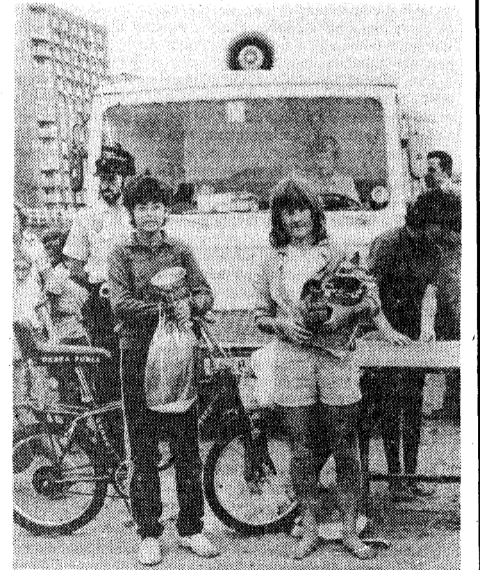
Primero y segundo premiados.

Ya tengo padrino. Ya no pasará hambre. Y podrá ir a la escuela en vez de trabajar todo el día.