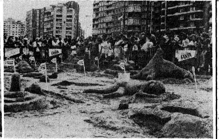
Aspecto general del concurso.

Organizado por Coca-Cola y LA NUEVA ESPAÑA: Concurso de castillos en la arena