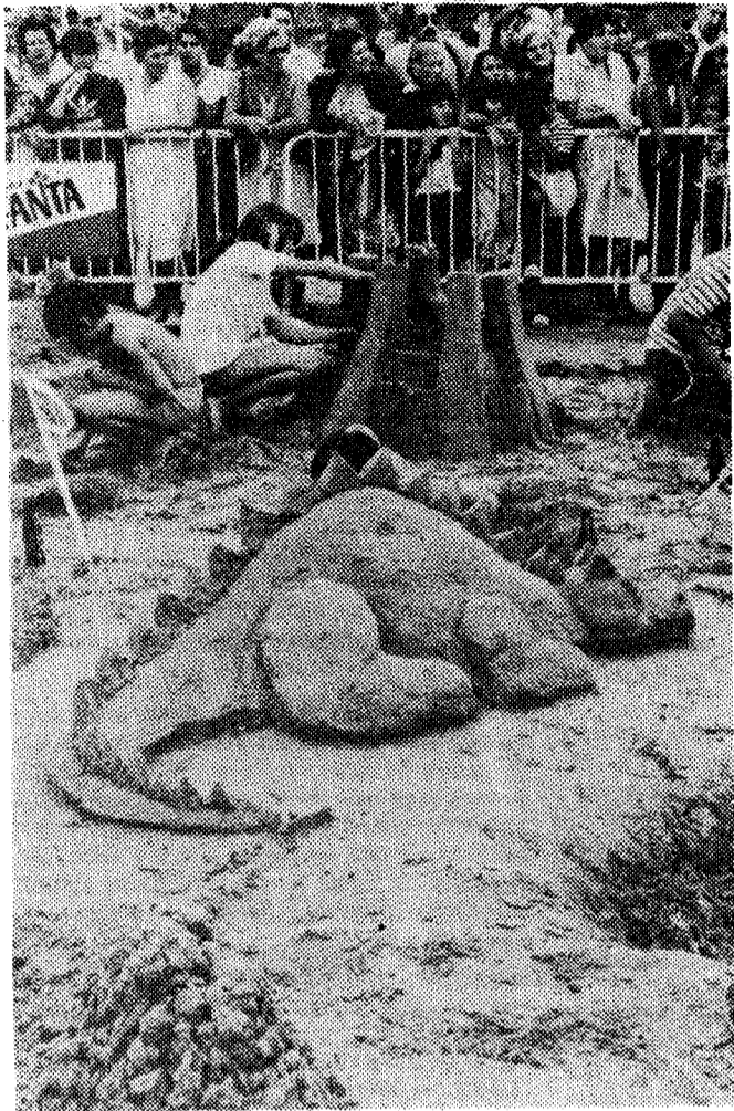
Una de las figuras.