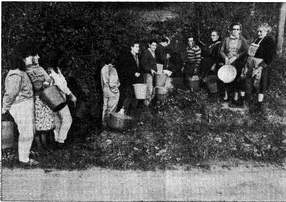
Los vecinos de La Falconera acuden a un pozo por agua.

Ocho familias del barrio de La Falconera, en Veriña, sufren desde hace años su sequía particular. El invierno especialmente seco que padecemos obliga a una veintena de gijoneses a encargar agua mediante su correspondiente pago, o traerla en bidones de fuentes más o menos próximas. A cuatrocientos metros de este barrio rural gijonés, llega desde hace tiempo la infraestructura de la Empresa Municipal de Aguas, pero a los vecinos de La Falconera ni siquiera un pozo realizado en su día por la empresa Constructora Internacional les sirve de gran ayuda. El problema del agua es uno más de los muchos que padecen estas familias que se han convertido en gijoneses de tercera. A un lado, Ensidesa-Veriña; al otro, la térmica de Aboño. A cincuenta metros, una carretera diabólica —la Gijón-Avilés— y, para completar el panorama, un paso a nivel de Feve, poco menos que en el porche de sus puertas, y que ya ha causado víctimas mortales.