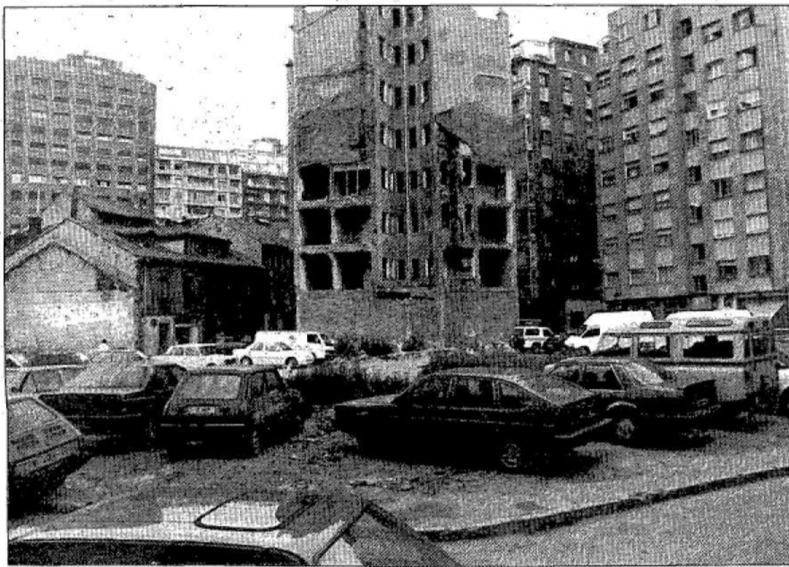
Un aspecto de los solares de la avenida de la Costa.

La sentencia conocida ahora procede de la Sala de lo Contencioso de la Audiencia Provincial y obliga al Ayuntamiento a