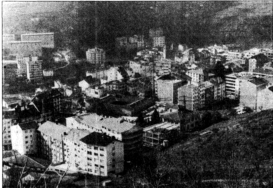
Cangas del Narcea, una villa con un desarrollo urbano caótico

Gutiérrez de Terán precisó que si las normas equivalían a una oportunidad histórica que