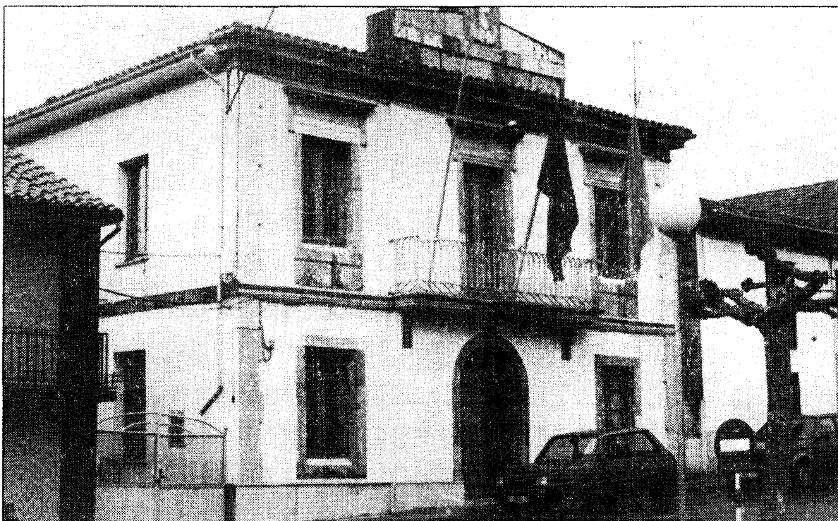
El Ayuntamiento de Soto del Barco incrementa las tarifas para autofinanciar los servicios municipales

En el tema de la contribución urbana se decidió mantener, salvo que entre en vigor la revisión catastral, el tipo de gravamen del año 1985; de aplicarse la revisión del catastro, el tipo de gravamen sería del 22,5 por 100. Por último se llegó al acuerdo con los empresarios y hosteleros