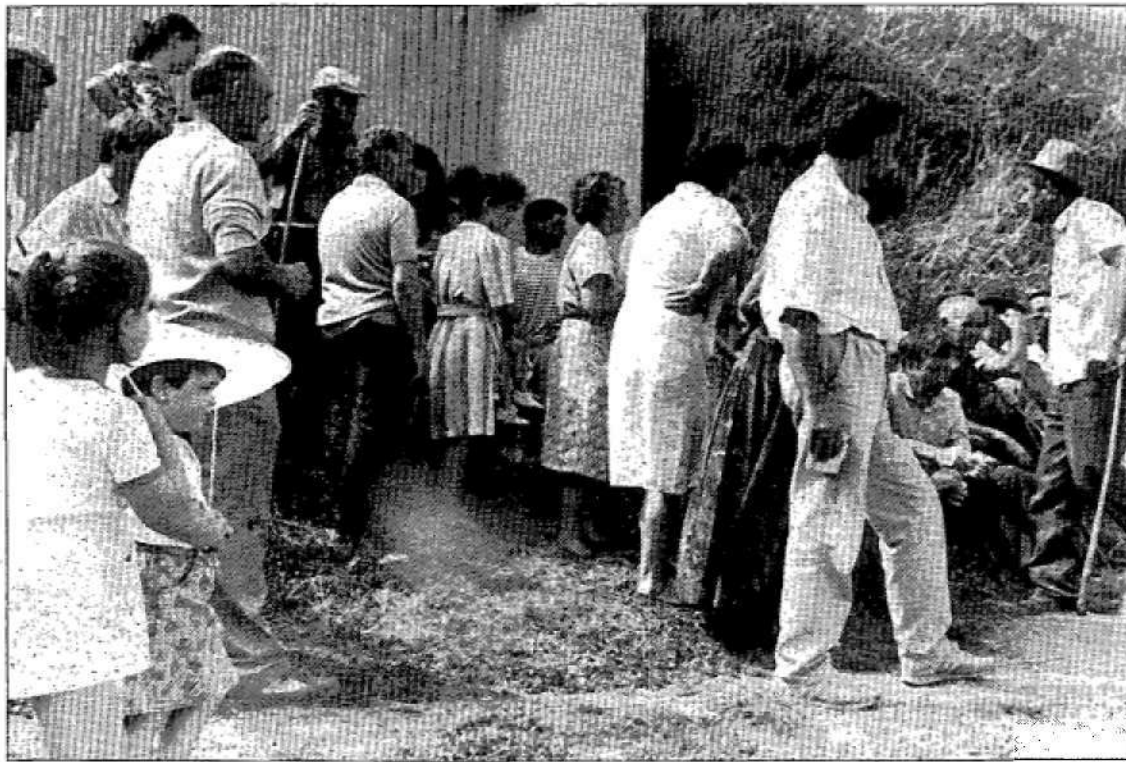
Los ganaderos protestaron airadamente por la incautación del ganado.

Un vehículo, en el que viajaban tres técnicos de la Consejería, estuvo retenido por los ganaderos en Boal durante tres horas. Los afectados por esta medida de incautación de ganado exigían para dejar paso al vehículo que se presentara en el lugar la alcaldesa de Boal, la cual se negó a ello, si bien permitió que una representación de los ganaderos bajase al Ayuntamiento para entrevistarse con ella. Por su parte, la Guardia