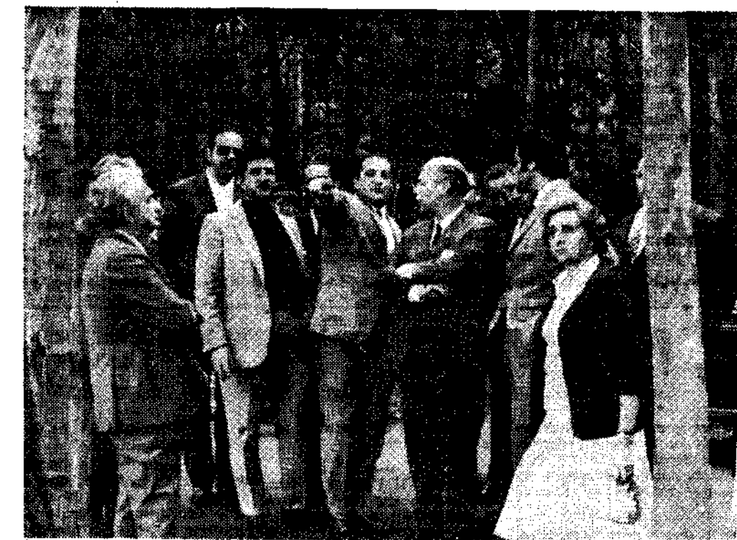
El alcalde de Navia explica a las autoridades los proyectos en «Veiga de Arenas».

EN NAVIA VISITO LOS TERRENOS DESTINADOS A CONSTRUCCION DE UN HOTEL DE CIENTO CINCUENTA HABITACIONES, Y COMPLEJO TURISTICO Y DEPORTIVO EN VEIGA DE ARENAS