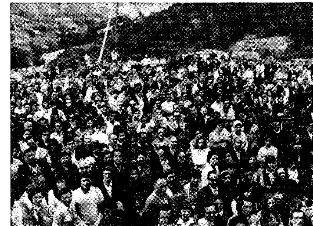
Boaleses presentes en las inauguraciones.

A las seis de la tarde del martes, después de haber presidido en el Colegio Menor de Juventudes de Lluarca una importante reunión informativa de los Consejos Locales del Movimiento de la zona occidental de Asturias, el jefe provincial del Movimiento, presidente de la Diputación, consejero nacional y procurador en Cortes por Asturias y delegados provinciales de Información y Turismo y de Juventudes y otras autoridades y representaciones, visitaron Navia, donde las autoridades locales, presididas por el jefe del Movimiento de esta villa y alcalde, enseñaron al jefe provincial los planos de ordenación urbana, así como los proyectos y obras que pronto entrarán en ejecución. En la avenida de José Antonio, a la entrada de la villa de Campoamor, cerca del cruce de la carretera a Villayón, próximo a la ría, se proyecta la construcción, por un industrial del ramo de hostelería, de un magnífico edificio para hotel, de siete plantas y un total de ciento cincuenta habitaciones. Posteriormente, y en Navia, se trasladaron a la zona de la playa, donde, en la maravillosa Veiga de Arenas, se proyecta por parte del Ayuntamiento un gran complejo turístico y deportivo, con el previo saneamiento, limpieza y drenaje en la citada zona, donde, como queda dicho, se pretende construir de forma inmediata (para lo que el gobernador civil dio toda clase de facilidades) parque y playa infantil, camping y otras instalaciones.