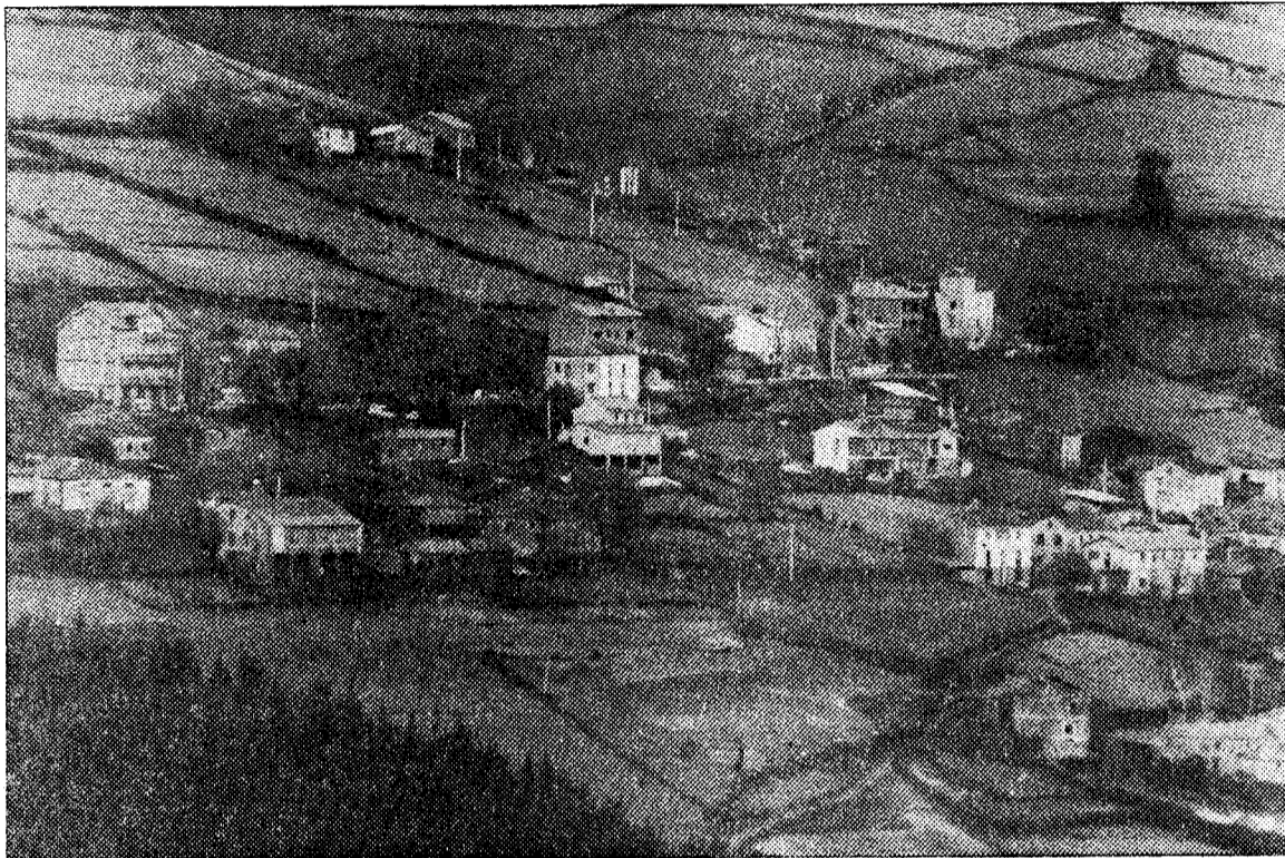
Illano, un concejo pionero en el movimiento asociativo de las zonas rurales asturianas

vecinos de Gio a solicitar el reconocimiento como parroquia rural se extiende desde el mismo pueblo hasta lo alto de la sierra de Illano. Gran parte de la plantación que tenía está quemada. Los incendios siguen haciendo estragos en el occidente asturiano. Otra parte se aprovecha como pasto.