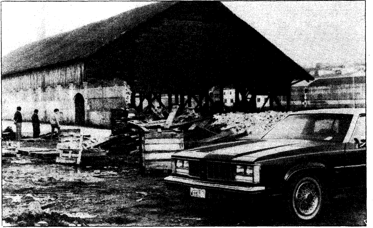
La nave de Lantero, otra vez en el centro de la polémica