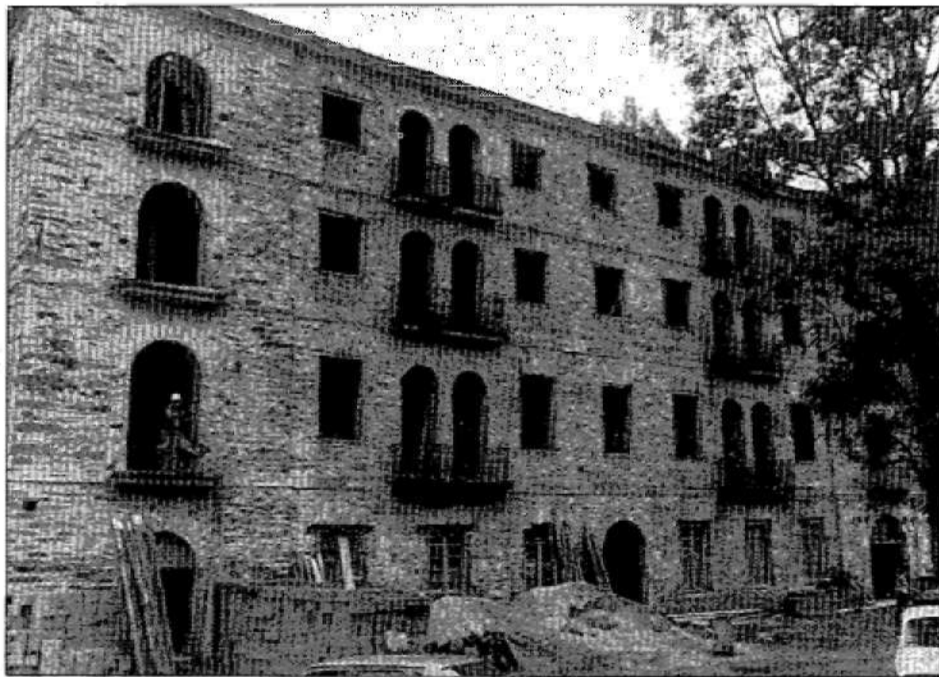
Un aspecto del exterior del caserón de Sestelo y de los trabajos de reconstrucción interna que se están llevando a cabo.

El arquitecto del proyecto, el gijonés Angel Rami, que ayer se encontraba en Taramundi para asistir a la inauguración de la Casa de la Cultura, cuyo proyecto también es suyo, hablaba también de las excelencias de la casa de Sestelo y de todo su entorno.