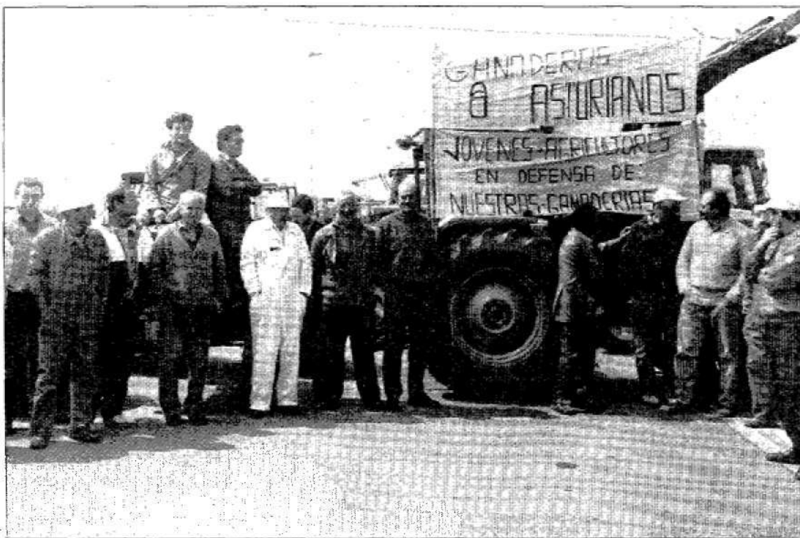
La organización Jóvenes Agricultores movilizó sus efectivos en el Occidente.

El punto álgido de los cortes estuvo en torno al puente de los Santos. En la localidad asturiana de Barres, poco antes del desvío al puente, casi un centenar de tractores cruzados en la carretera impedían el paso tanto en dirección a Ribadeo como hacia Vegadeo. Por su parte, los gallegos hicieron otro tanto de lo mismo y ya empezaron a tomar posiciones en la mitad del puente de los Santos, desde donde se iniciaba una amplísima caravana de más de 200 tractores que alcanzaba hasta la carretera de La Coruña. Algunas personas hubieron de valerse de una modesta bicicleta para poder cruzar el puente, aunque para ello tuvieron de hacer uso de las aceras de los peatones. No se registraron incidentes de ninguna naturaleza, aunque sí situaciones incómodas para los automovilistas. Algunos más avisados, y conocedores de todos los caminos de la zona, se vieron