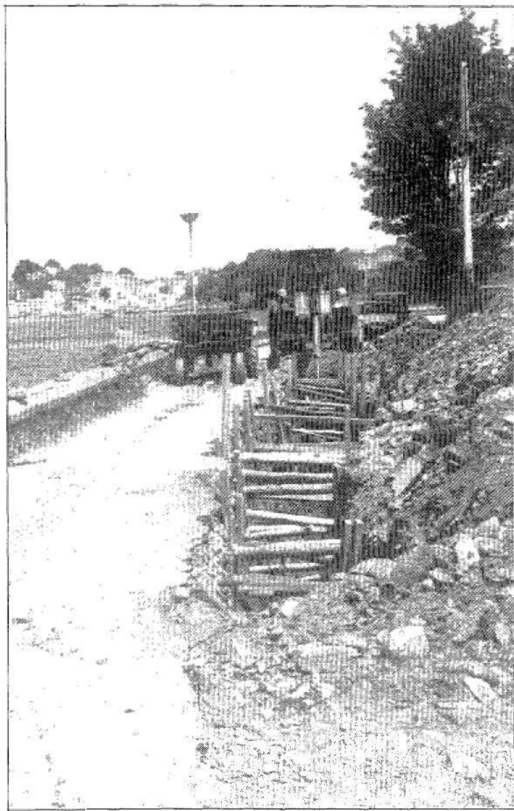
El muelle de Castropol, afectado por las obras.

Otros quinientos millones va a suponer la inversión de la zona de Castropol. No obstante, la nueva solución parece satisfacer mucho más las aspiraciones de los técnicos responsables, en cuanto consideran que el proceso de saneamiento es mucho más completo de esta forma. Por otra parte, el cambio del proyecto parece estar más en consonancia con la política acordada por los presidentes de ambas comunidades autónomas, Asturias y Galicia, para proceder, cada uno dentro de sus respectivas competencias, al saneamiento integral de la ría del Eo.