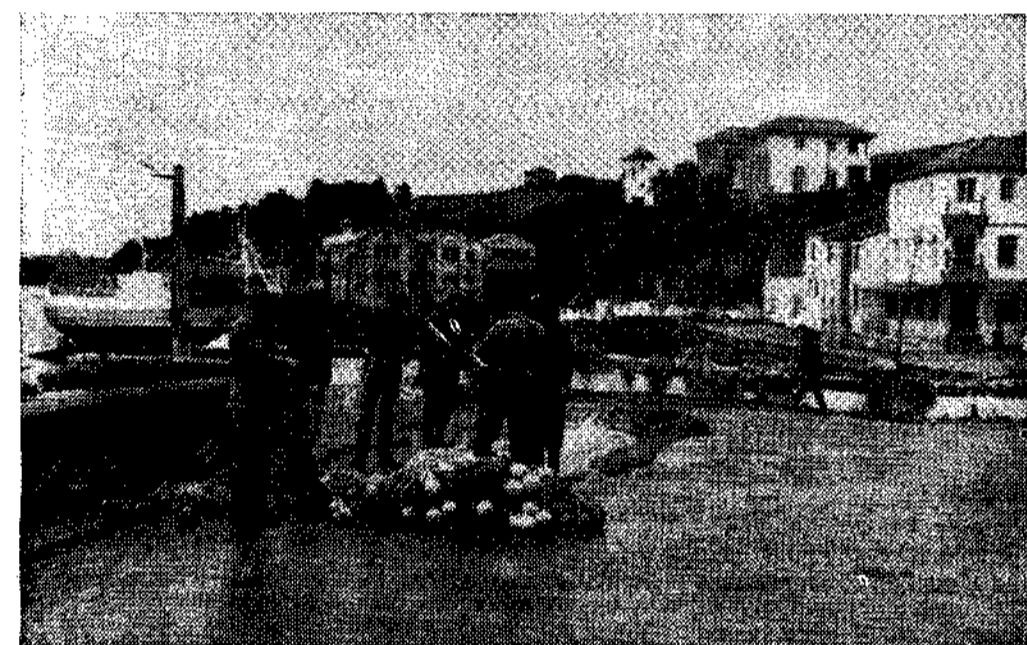
Marineros de Figueras. El astillero, al fondo

Se halla situado Castropol en la zona más occidental de Asturias en la misma desembocadura del río Eo, divisorio de nuestra región y la gallega. Atraviesa Castropol, como se sabe, por su parte norte, la carretera general Santander-La Coruña; será también, dentro de poco, punto de enlace de estas dos regiones por el proyectado puente de «Los Santos», que pasando por encima de la ría unirá las tierras castropolenses y de Ribadeo. Y se denomina así, de «Los Santos», porque el fantástico puente, que dicen pronto será construido, parte de San Román, en Figueras, a San Miguel, en la