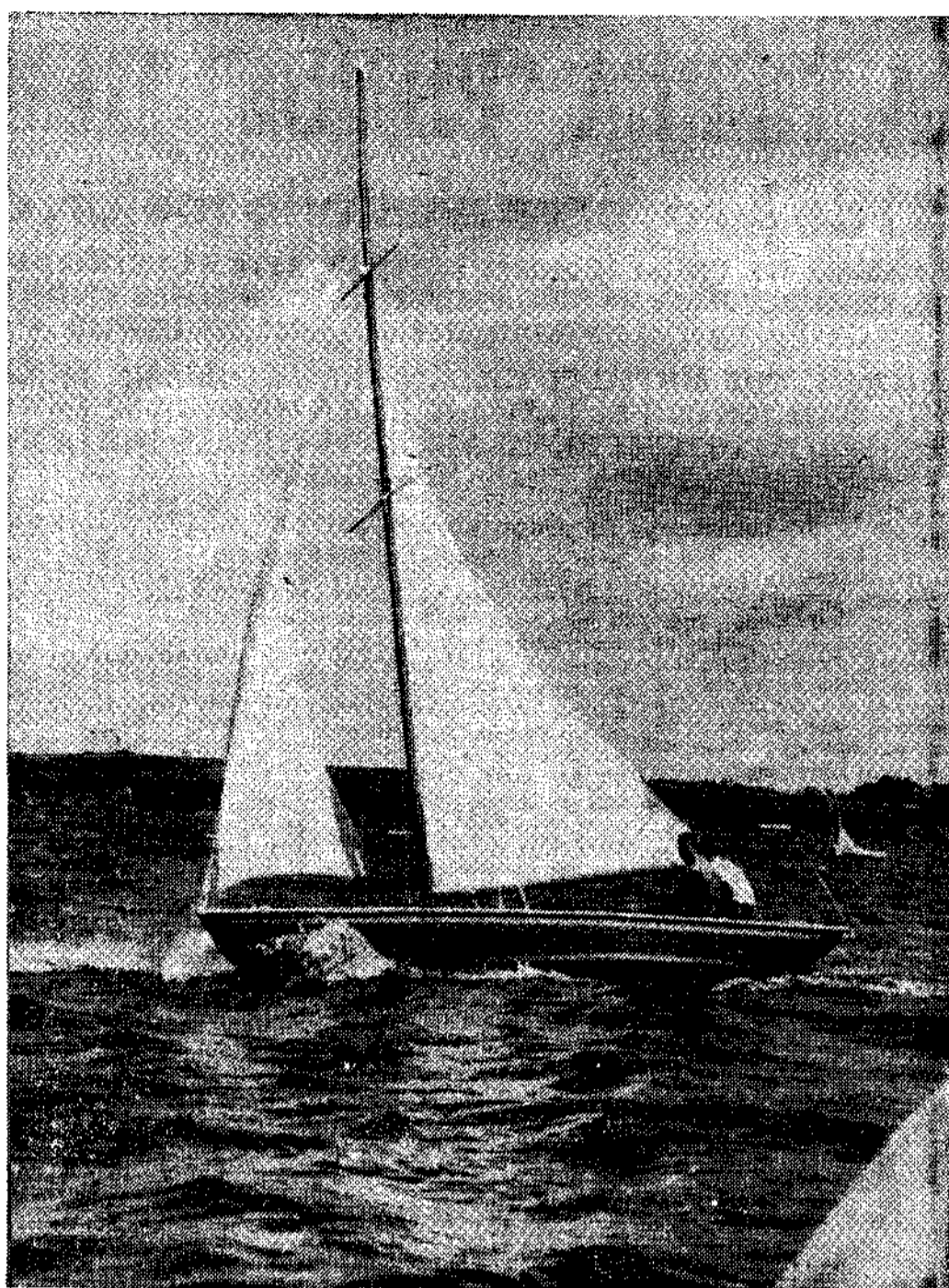
La amplia ría apta para la vela.

En Castropol, en Figueras, en Barres y demás pueblos de este concejo, de algo más de seis mil habitantes, tienen lugar renombradas fiestas y algunas ferias de ganado. En la capital del concejo, en Castropol, celebran las fiestas de Santiago Apóstol, que reúne a gran número de romeros de las zonas limítrofes asturgalaicas. Celebra también Castropol la fiesta marinera de San Roque, de antigua tradición; en Figueras tienen lugar las fiestas de la Virgen del Carmen en agosto, con solemne procesión por mar con la imagen de aquella, a quien acompañan multitud de otras embarcaciones procesionalmente por la ría del Eo; también Figueras tiene otra fiesta, San Román, que se celebra en el campo de la pequeña ermita a la entrada de la ría. San Pedro tiene lugar en Barres, con gran afluencia de romeros, la de la Virgen, en Vilavedelle, en septiembre, es muy concurrida. San Bartolo, en Piñera, es fiesta grata y de renombre también, como lo es asimismo la fiesta de las gaitas en Presno, Santa Eulalia, la Patrona de la parroquia. Y en Seares (el famoso pueblo de la Searilla romántica) tiene lugar