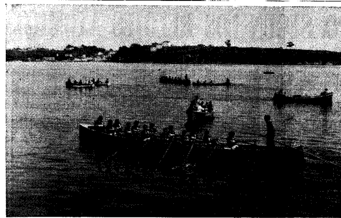
El remo, deporte sobresaliente en Castropol