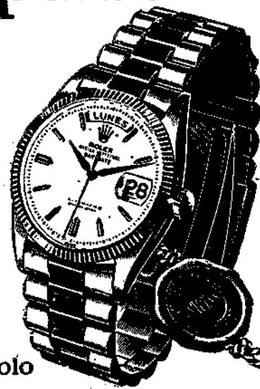
CRONOMETRO O.P. DAY-DATE Impermeable - Automático. Fecha muy legible aumentada por lente Cyclops. El día de la semana con todas sus letras.

JOYERIA CASAPRIMA Nuevo establecimiento en Uría, 1 - OVIEDO