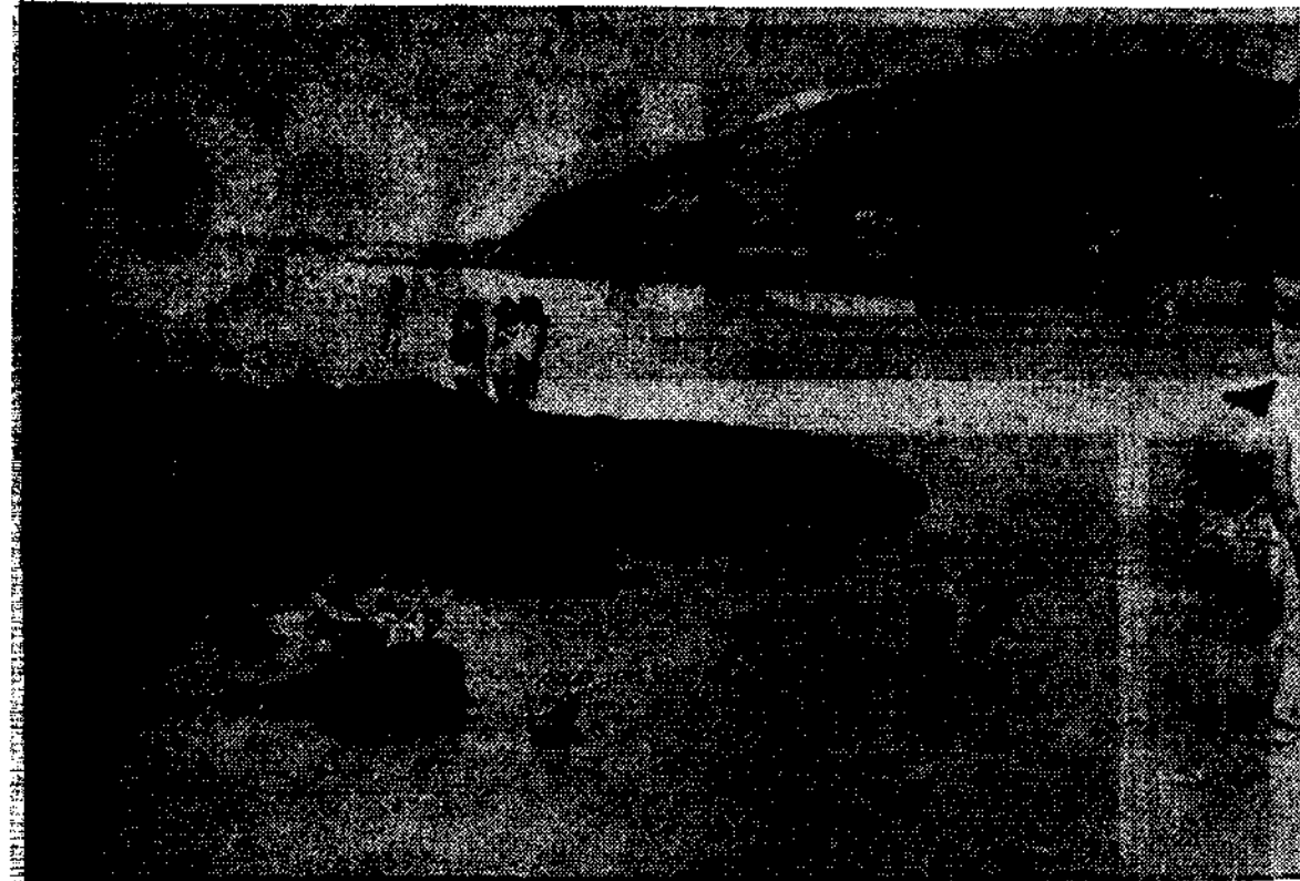
Playa de Porcia.