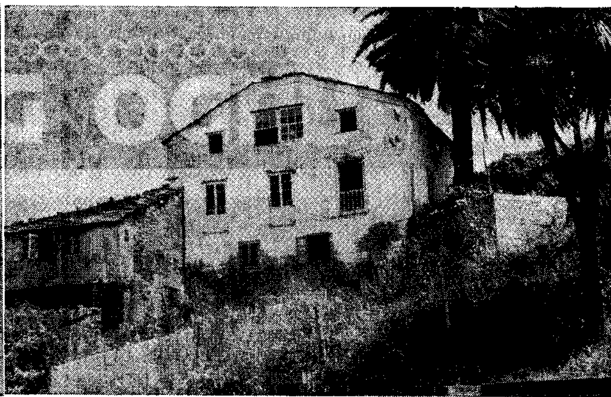
Casa donde nació la novelista Corín Tellado, en Viavélez.